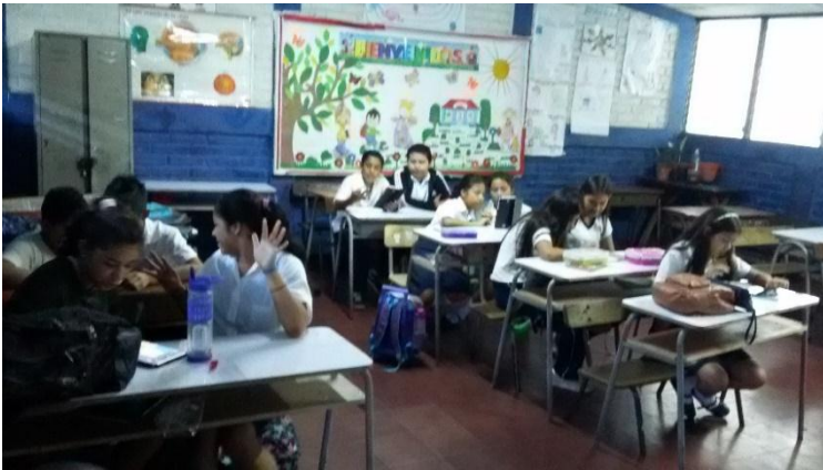
C.E. CANTON GRANADILLAS 25/7 /19