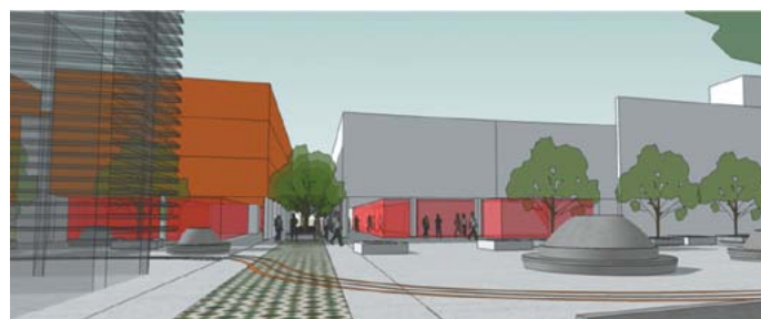
Centro de Convenciones.

En nuestra ciudad hemos demostrado que soñar en grande, nos permite hacer cosas grandes. A más de 10 años de cambios, estamos convencidos que se puede hacer mucho más, por eso con el acompañamiento de todos los sectores y, por supuesto, con el de la familia teceleña, pondremos en marcha otra serie de proyectos ambiciosos que reafirmarán a Santa Tecla como un modelo de gestión.