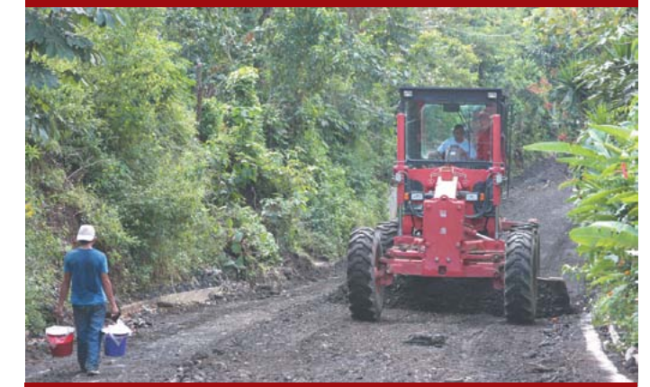
Obras de mantenimiento vial en la zona rural.