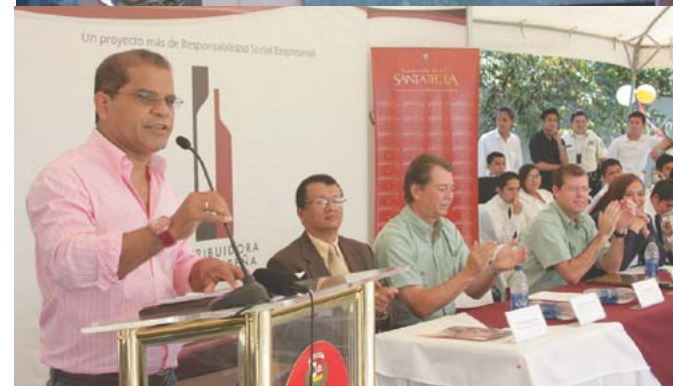
Asocio público-privado con Distribuidora Salvadoreña para remodelación de Parque Las Colinas.