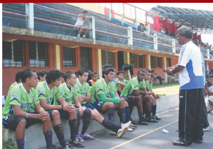
Santa Tecla Fútbol Club.