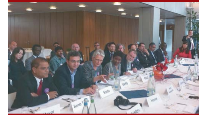
Alcalde Ortiz participa en congreso "Ciudades en riesgo: afrontar los retos del riesgo de desastres en el medio urbano", en el marco de 65 asamblea general de la ONU.