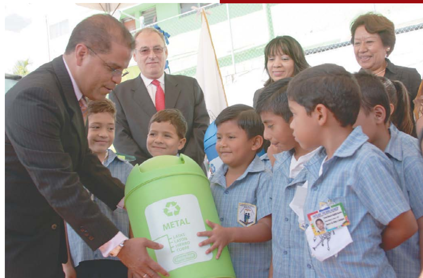
Lanzamiento del proyecto Santa Tecla Recicla.