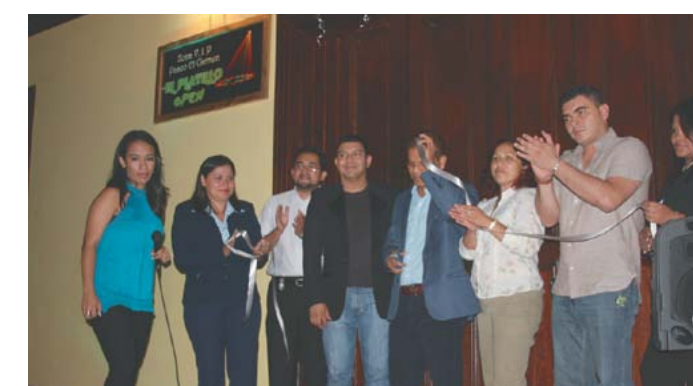
Inauguración restaurante El Platillo.