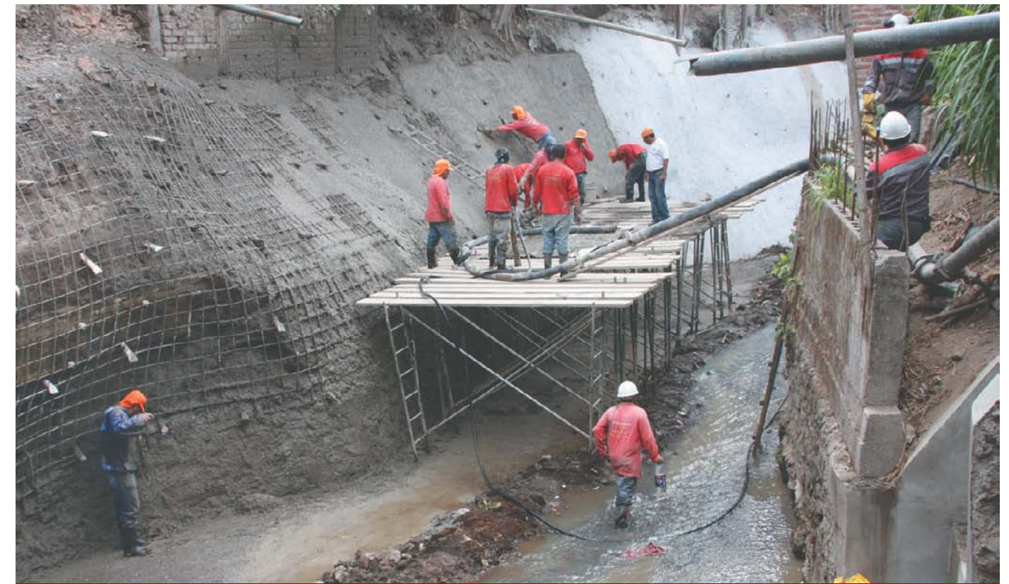
Obras de mitigación en Quebrada El Piro.