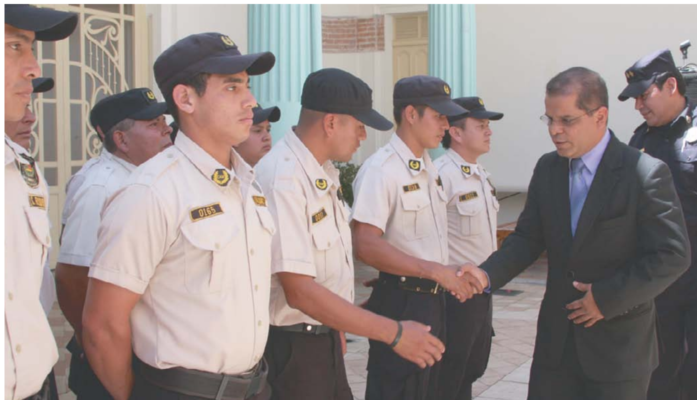
Funcionamiento del Cuerpo de Agentes Municipales Comunitarios.