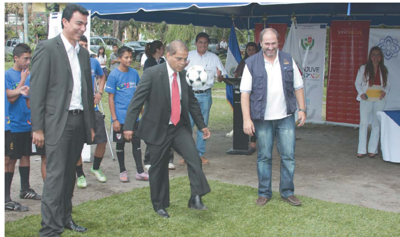
Inicio de trabajos de canchas con grama sintética en El Cafetalón.