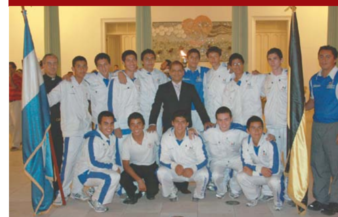
Delegación de deportistas del Colegio Santa Cecilia participantes en el CODICADER.