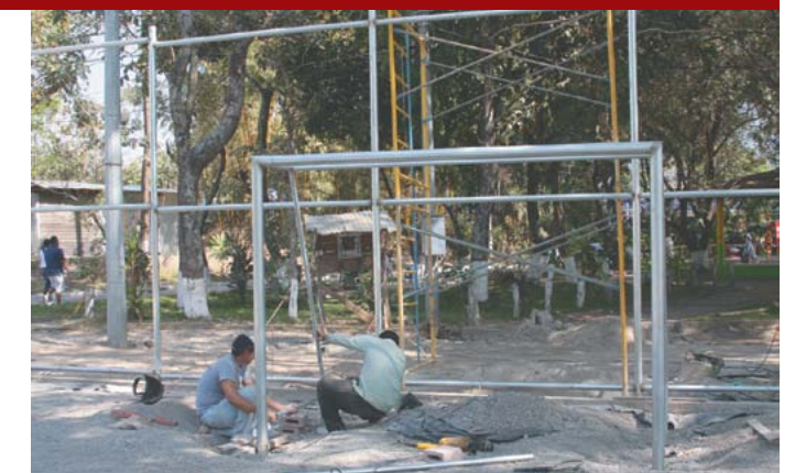
Canchas con grama sintética en El Cafetalón.