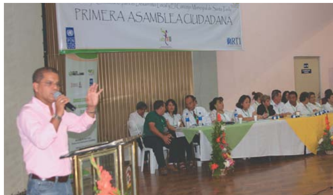
Primera Asamblea Ciudadana 2011.