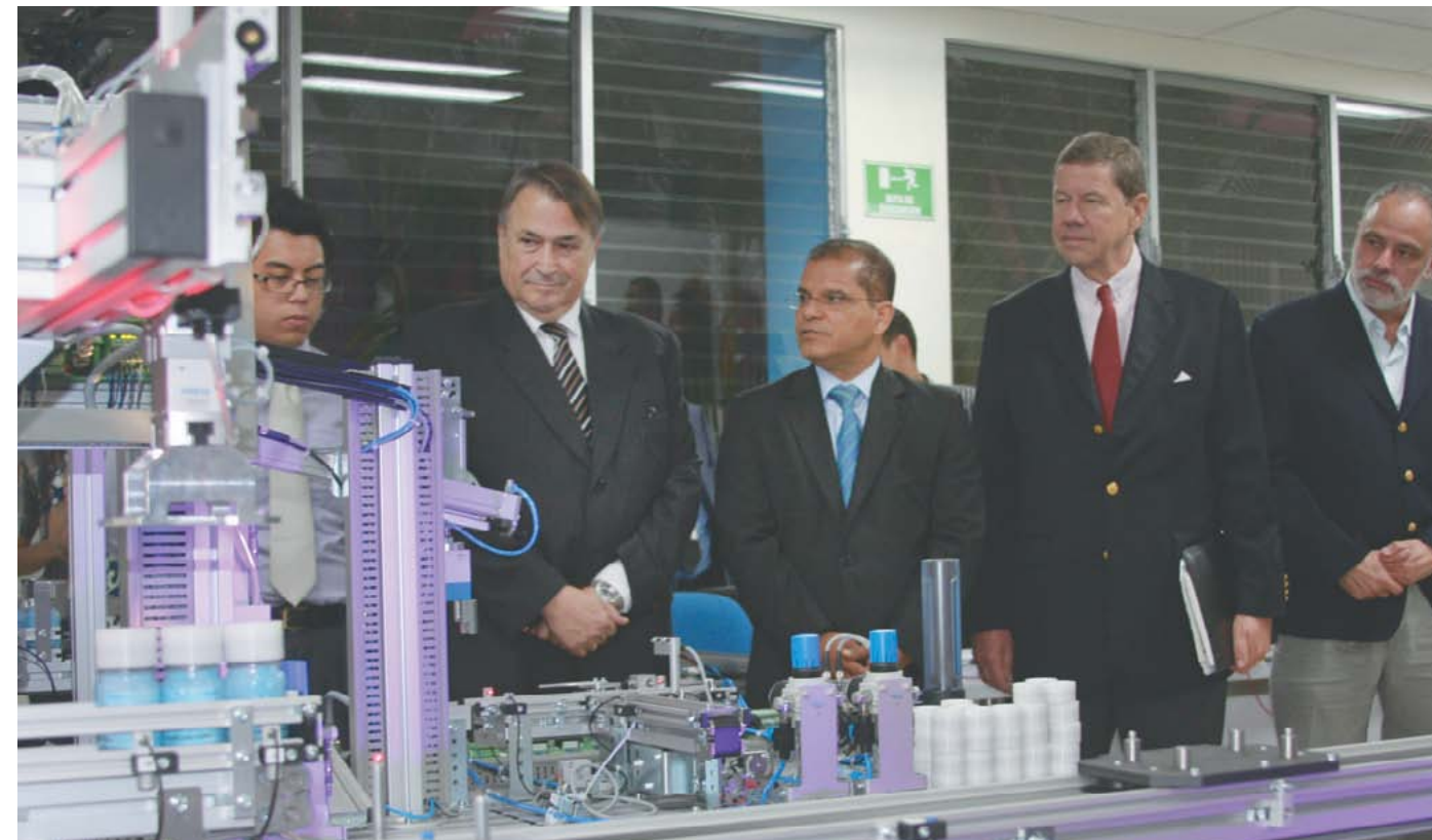
Inauguración de Laboratorios de Mecatrónica en ITCA.