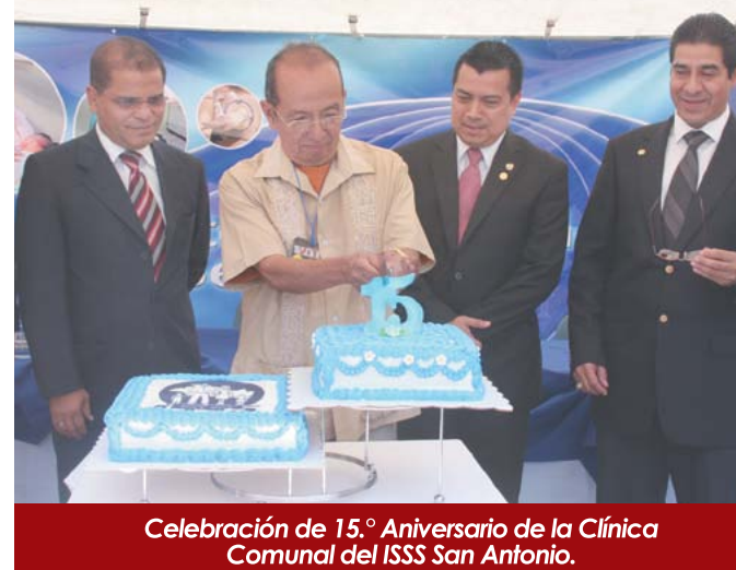
Celebración de 15.º Aniversario de la Clínica Comunal del ISSS San Antonio.