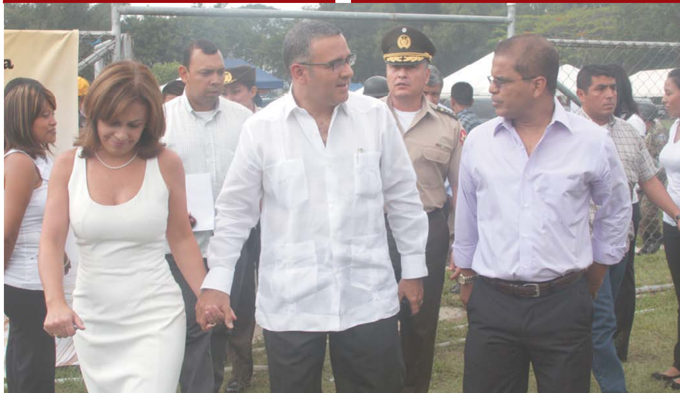
Alcalde Ortiz, presidente Funes y primera dama en lanzamiento del año agrícola.