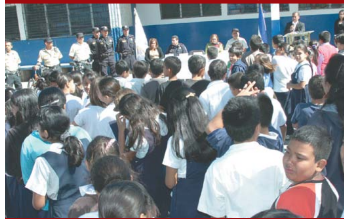
Lanzamiento del Plan Centros Escolares Seguros.