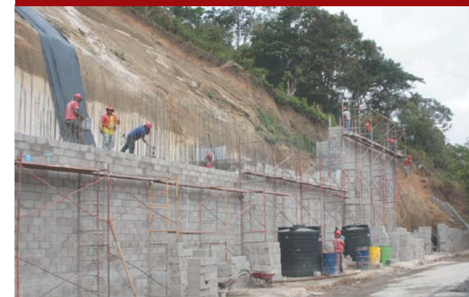
Obras de mitigación en Cordillera del Bálsamo.