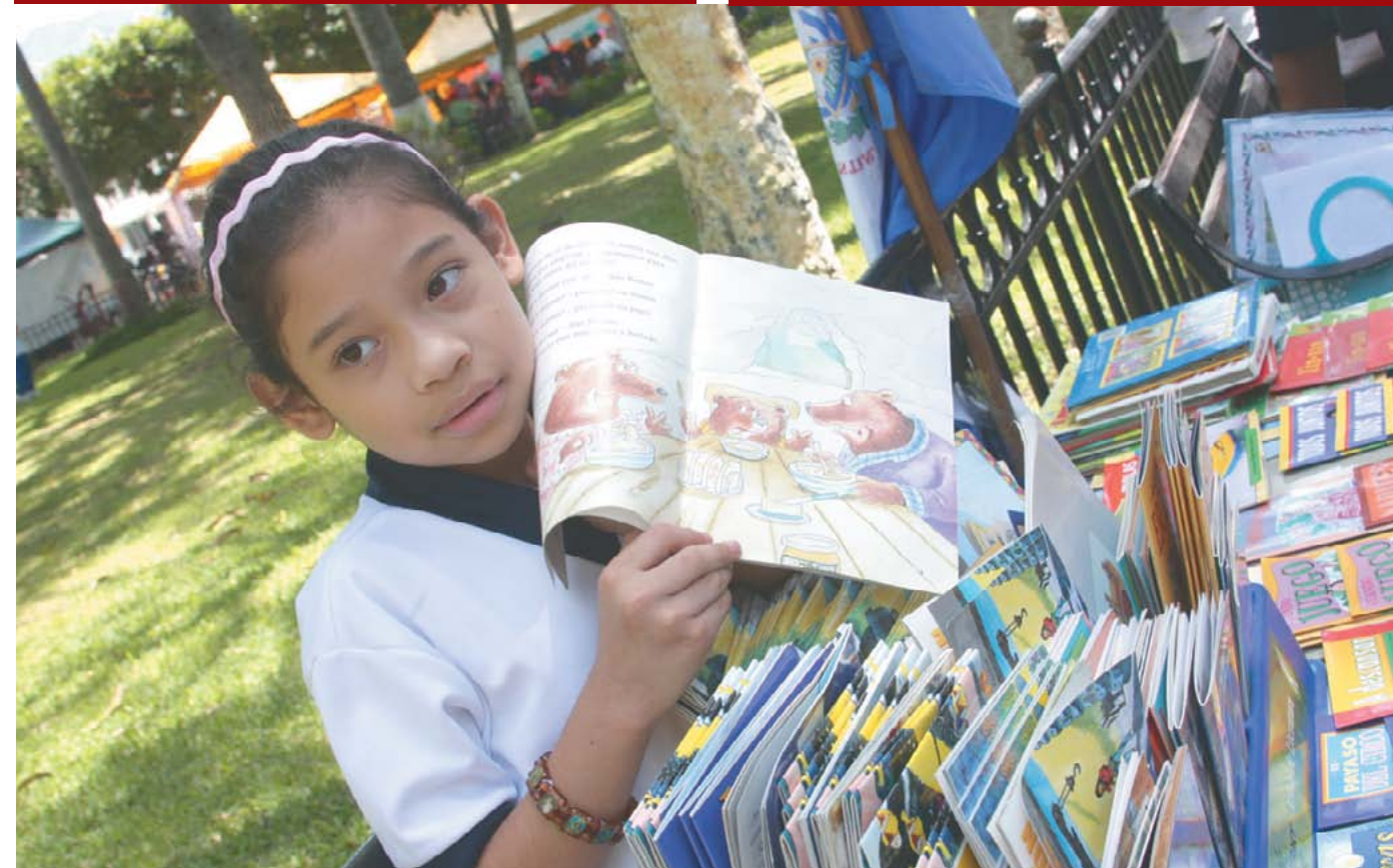
Promoción del hábito de la lectura entre la niñez tecleña.