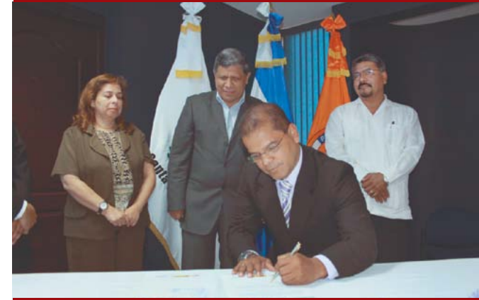
Santa Tecla firma su adhesión a la campaña "Desarrollando ciudades resilientes".