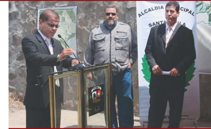
Campaña de limpieza de quebradas con el apoyo reos en fase de confianza, a través de la Dirección de Centros Penales.