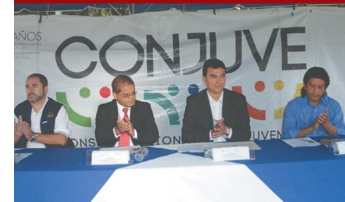
Remodelación de canchas de El Cafetalón en conjunto con CONJUVE.