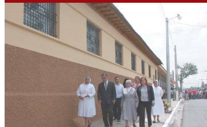
Inauguración acera sur del Colegio Santa Inés.