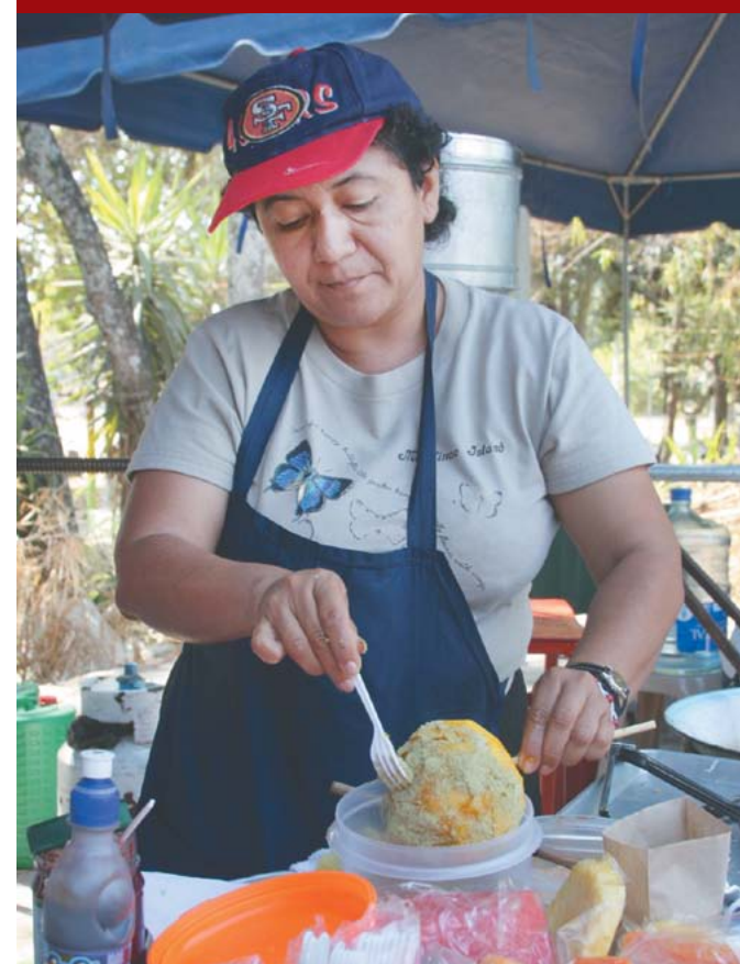
Promoción del emprendedurismo en las mujeres.