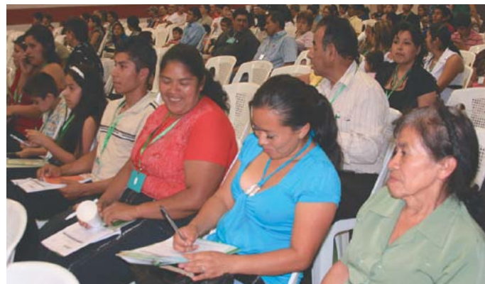
Ciudadanía organizada participó en Primera Asamblea 2011.

primera vez Santa Tecla ha sido la coordinadora del proyecto, teniendo como ciudades socias a Quito, Ecuador y Saint Denis Francia y como cooperante a la Unión Europea.