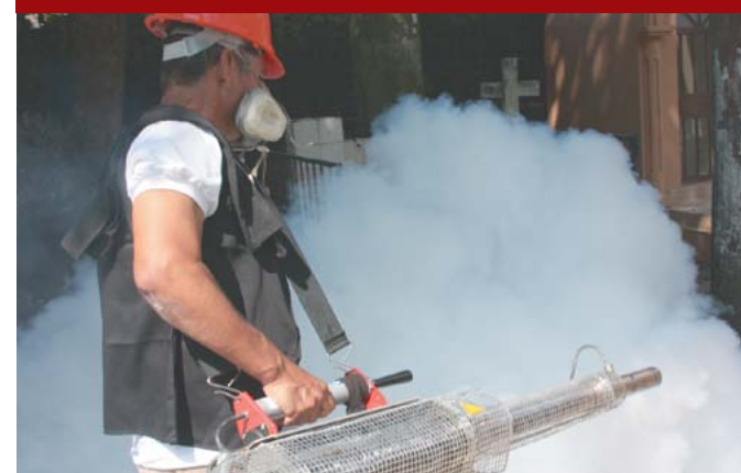
Campañas de prevención del dengue.