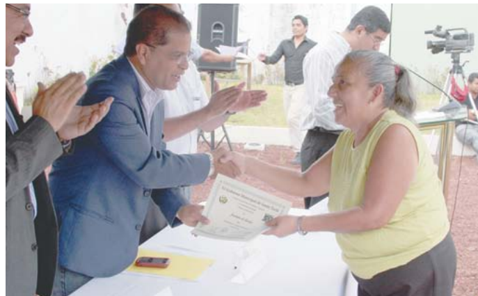
Talleres de formación para adultos mayores.