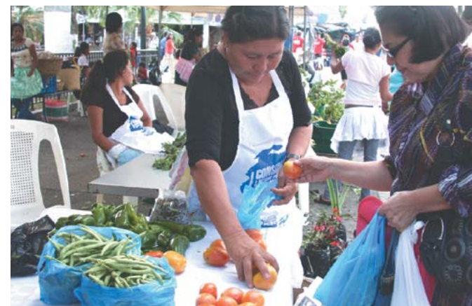
Ferias de de comercialización para productoras rurales.