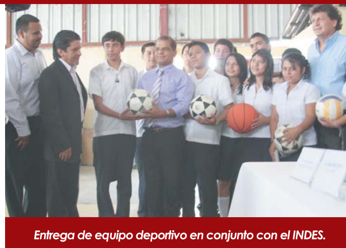
Entrega de equipo deportivo en conjunto con el INDES.