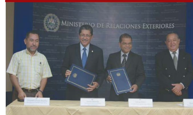
Firma de convenio con el Ministerio de Relaciones Exteriores y FUTECA, para proyecto Colonia La Colina.