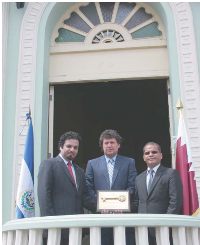
El encargado de negocios de la embajada del Estado de Qatar, Hamad Al-Kuwari recibe llaves de la ciudad en nombre de su excelencia Sheikh Mohammed Bin Hamad Al-Thani, con el fin de simbolizar en inicio de las relaciones de amistad.