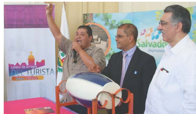
Alcalde Ortiz y Ministro de Turismo en Lotería Pueblos Vivos.