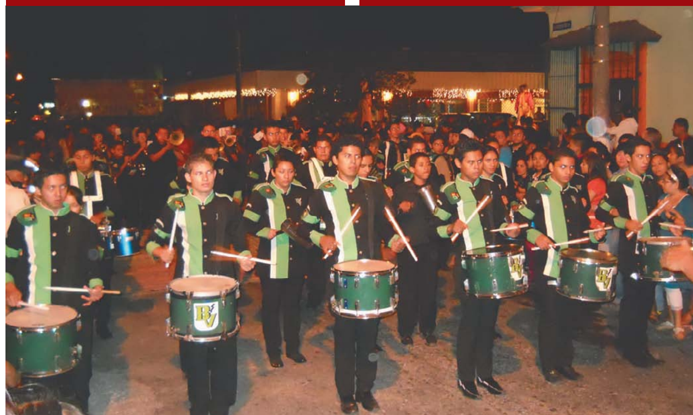
Festival Internacional de bandas de paz.