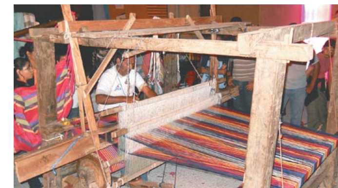
Espacios de participación para el emprendedurismo.

El proyecto incluye el equipamiento de espacios comunitarios y formación de jóvenes, hombres y mujeres en temas de interés local. Por