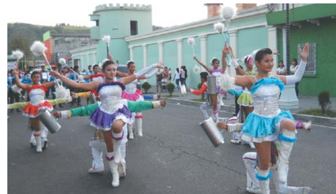
Coloridos desfiles en el Distrito Cultural.