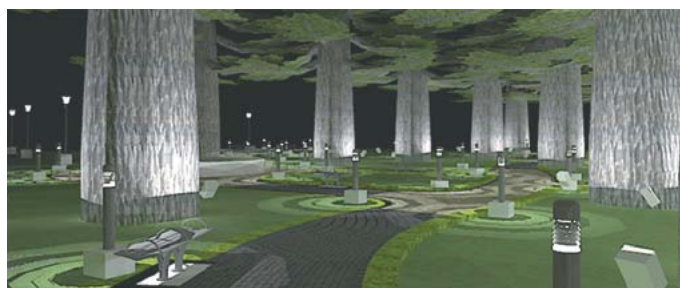
Parque Municipal Las Araucarias.