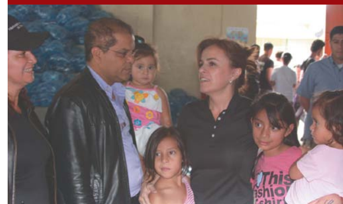
Visita de la Secretaria de Inclusión Social, Vanda Pignato a albergue del Gimnasio Adolfo Pineda