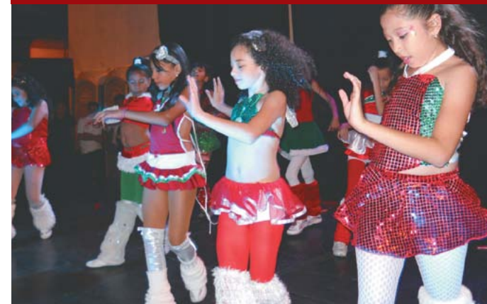
Actividades artísticas navideñas.