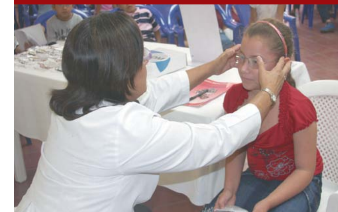
Jornadas de salud visual.