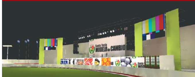
Estadio Las Delicias Fase II.