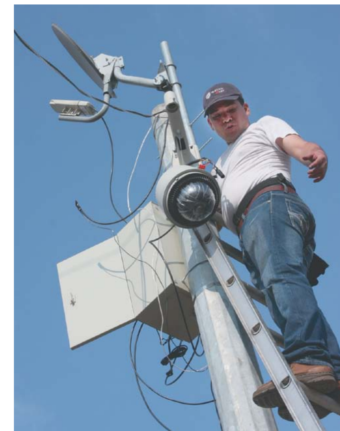
Sistema de Videovigilancia en espacios públicos.