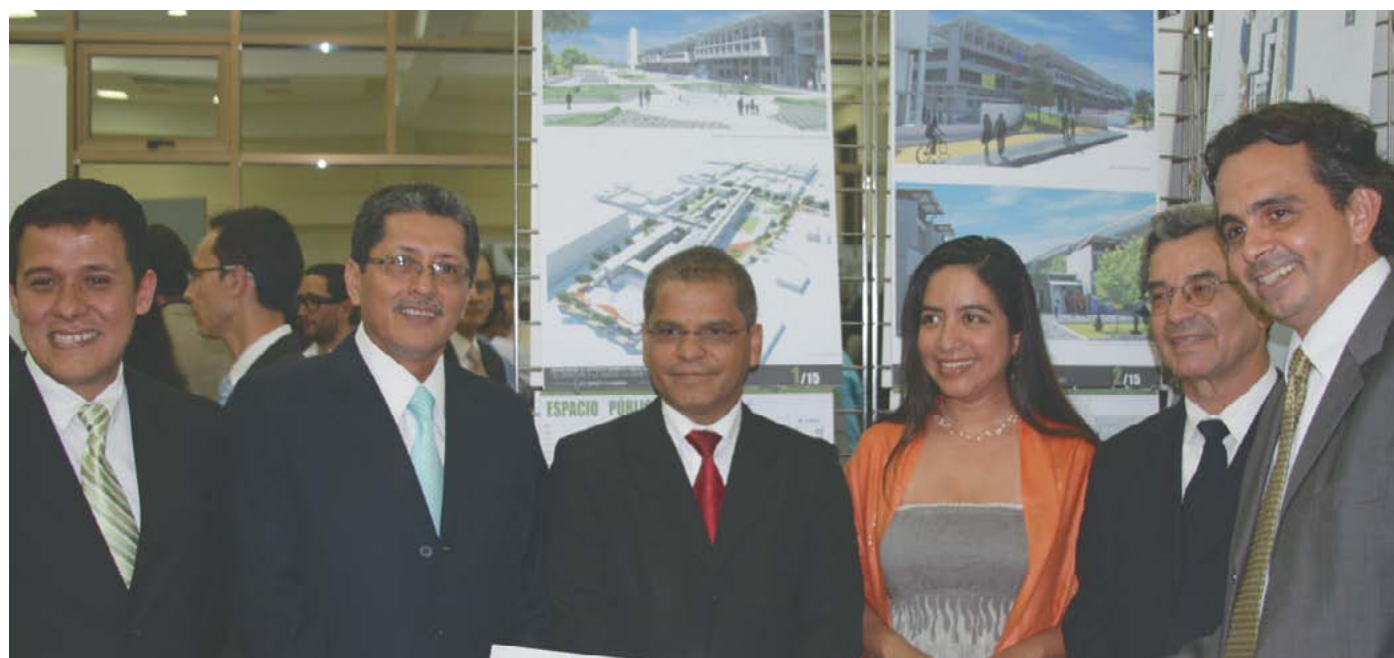
Alcalde Ortiz y viceministro de Relaciones Exteriores, Jaime Miranda, en premiación de concurso "La Gran Manzana".

Y gracias al respaldo del Gobierno Central estamos haciendo realidad el fortalecimiento de nuestra red vial, la mega obra del Estadio Municipal Las Delicias, las canchas con grama sintética y estaciones de ejercicio en El Cafetalón, las obras de mitigación en la Cordillera El Bálsamo, y otros proyectos que son estratégicos para el desarrollo de Santa Tecla.