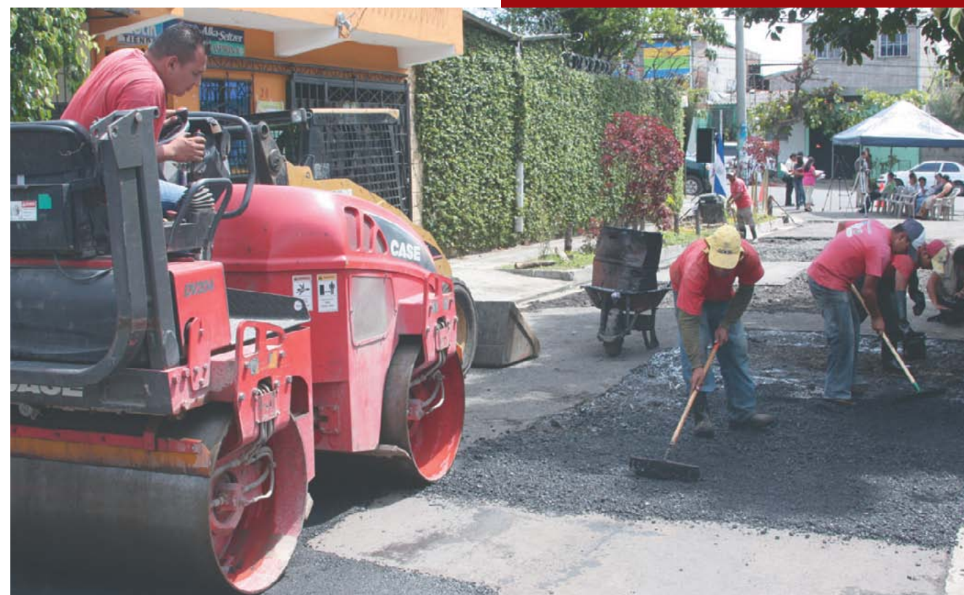
Obras de mantenimiento vial de manera permanente en todo el municipio.