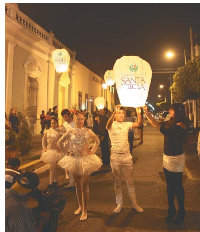
Inseparable de las expresiones artísticas.