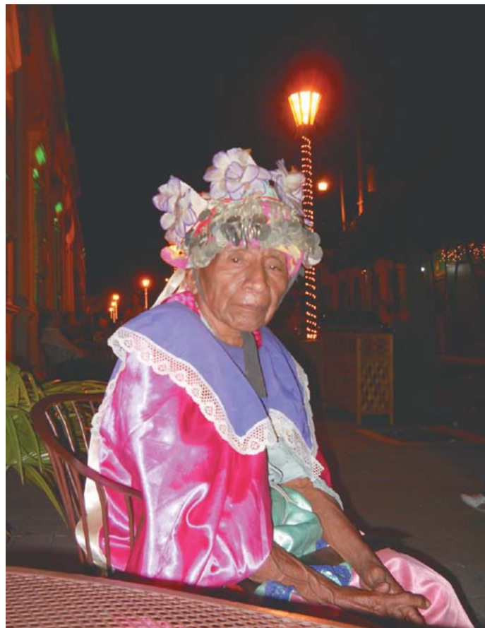
Una ventana a la cultura en Paseo El Carmen.