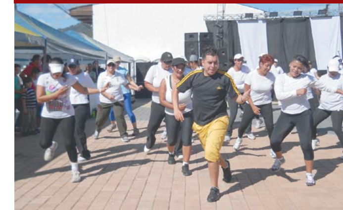
Master clase de aeróbicos en Plaza de la Música.