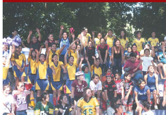
Torneos juveniles en diferentes ramas deportivas.