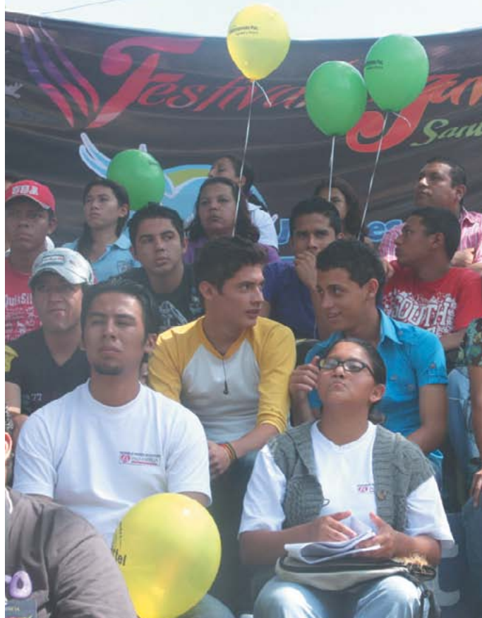
Espacios de participación para la juventud teclena.