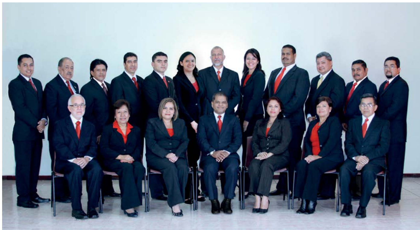
Inseparables del servicio a la familia tecleña...