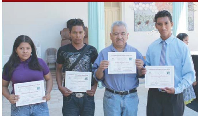
Alfabetización digital en los telecentros municipales.