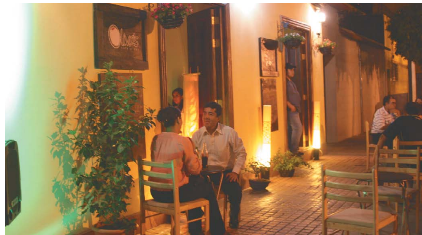
Funcionamiento de negocios formales en Paseo El Carmen.