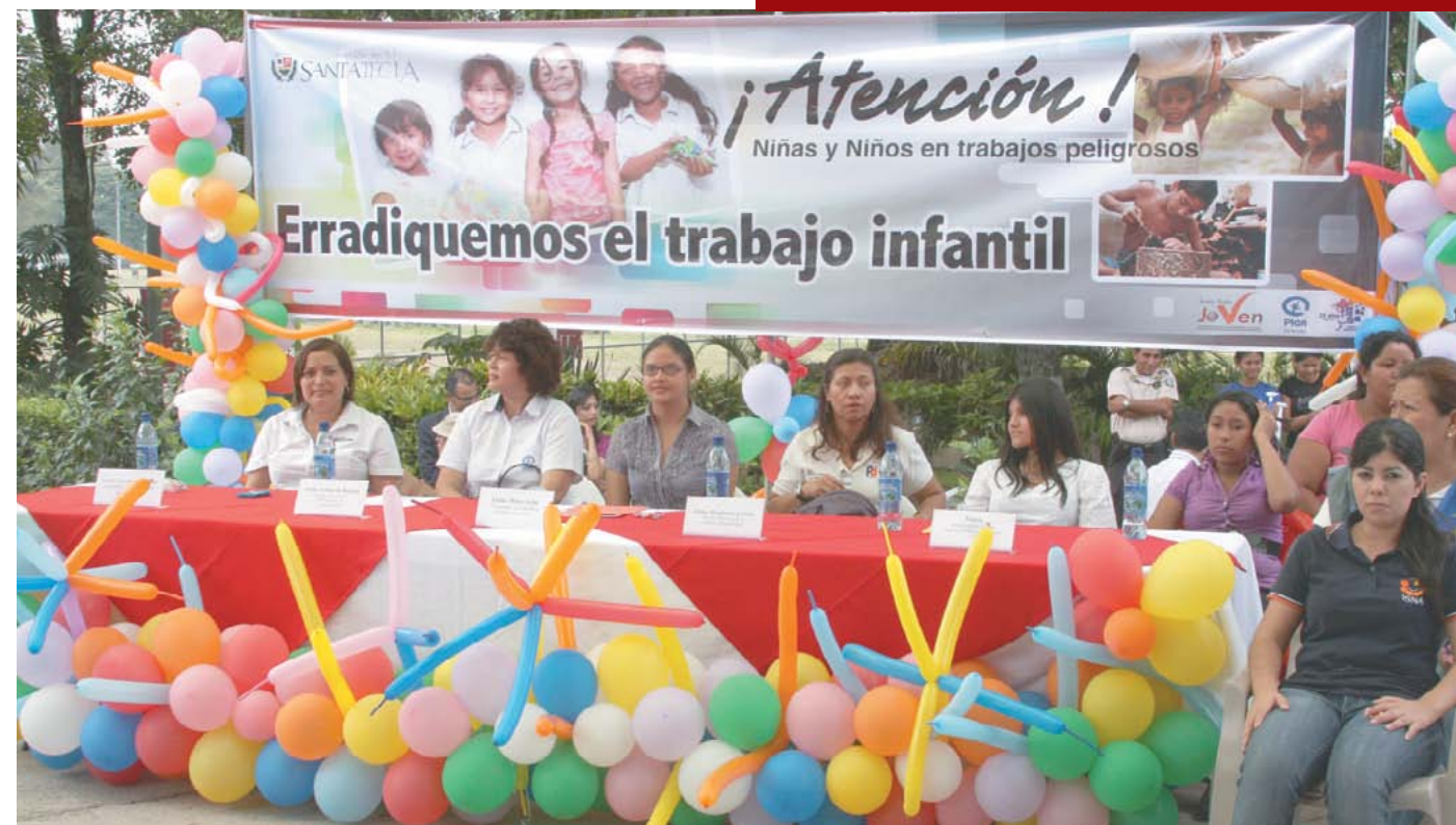
Programa de erradicación del trabajo infantil en los mercados.