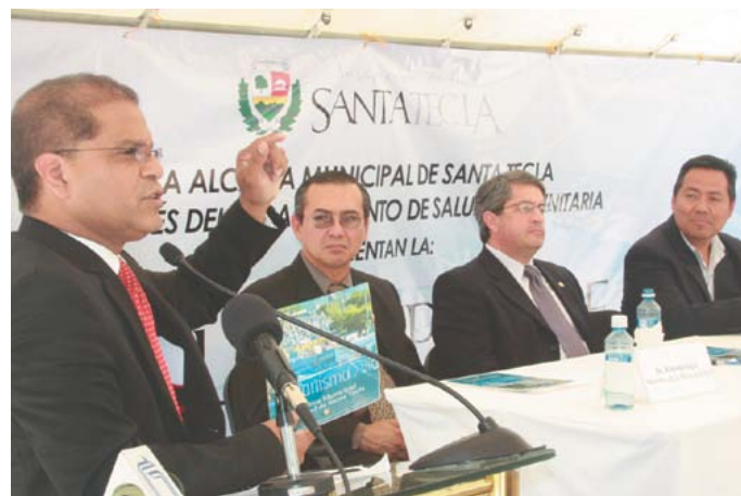
Presentación de la Política Municipal de Salud.

Santa Tecla también se prepara para impulsar un Mega Proyecto de reciclaje denominado "Desechos Cero", una iniciativa exitosa en Brasil, y que busca replicarse en nuestro país, tomándonos como municipio piloto.