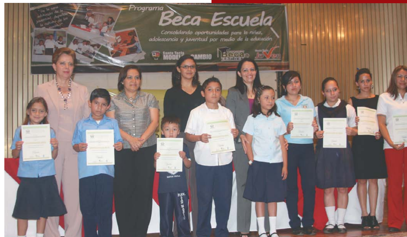
Más de 250 estudiantes son beneficiados año con año con becas escolares.