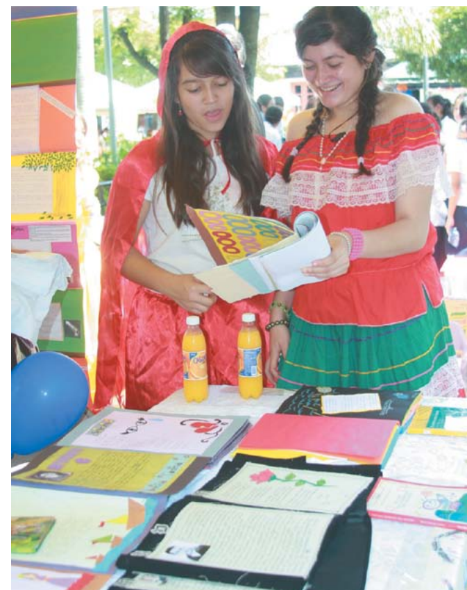
Festival de la lectura.