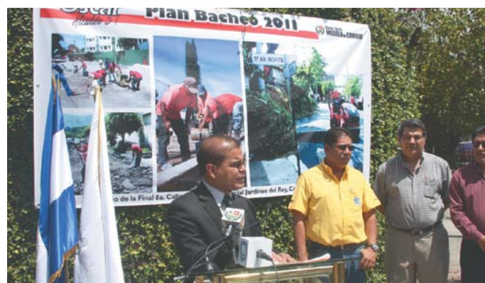
Lanzamiento del Plan Bacheo 2011.

Prueba de ellos es la instalación de más de 40 cámaras de seguridad instaladas en diferentes puntos del municipio e internet inalámbrico.