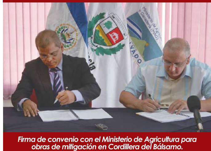
Firma de convenio con el Ministerio de Agricultura para obras de mitigación en Cordillera del Bálsamo.