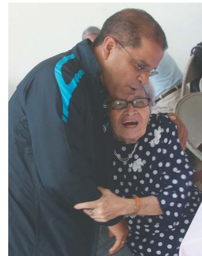
Apoyo al adulto y adulta mayor.