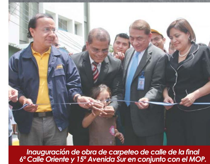
Inauguración de obra de carpeteo de calle de la final 6ª Calle Oriente y 15ª Avenida Sur en conjunto con el MOP.