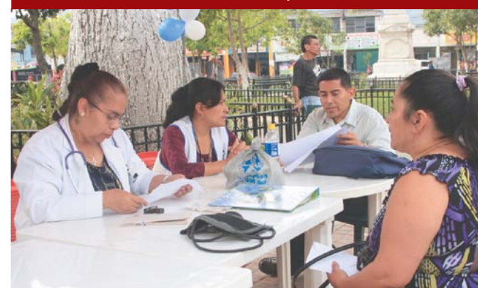
Ferias municipales de salud.