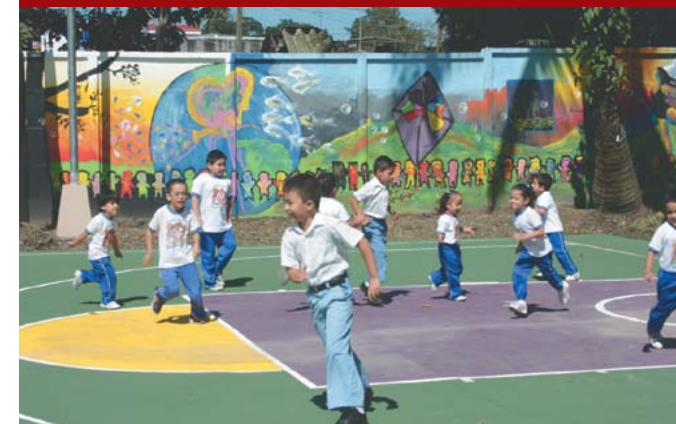
Inauguración de Parque Las Colinas.