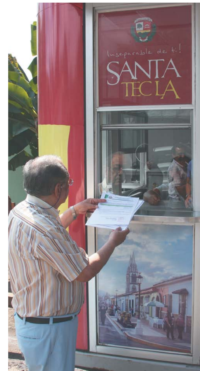
Nuevas casetas de atención al contribuyente.