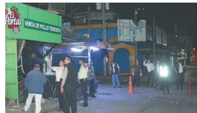
Operativo de reordenamiento del Centro Histórico.