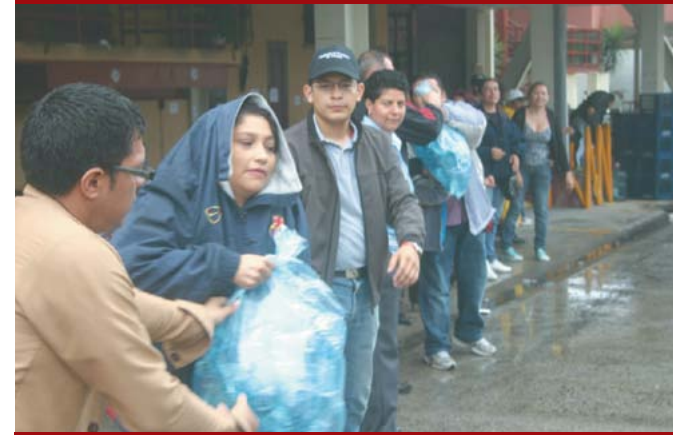
Centro de Acopio habilitado en la Alcaldía Municipal.