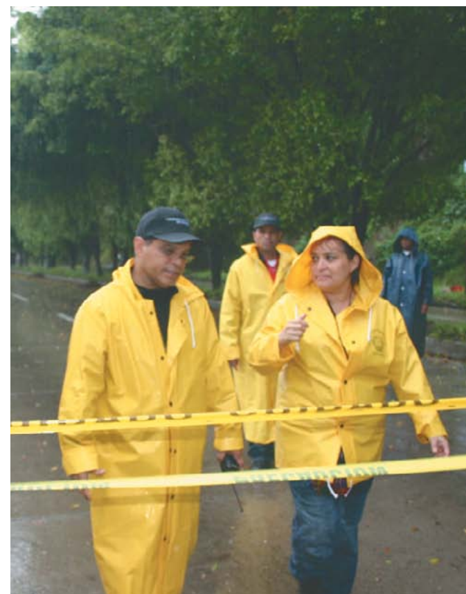
Verificación de daños durante la depresión tropical 12E.