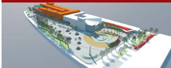
Proyecto Integral La Gran Manzana.