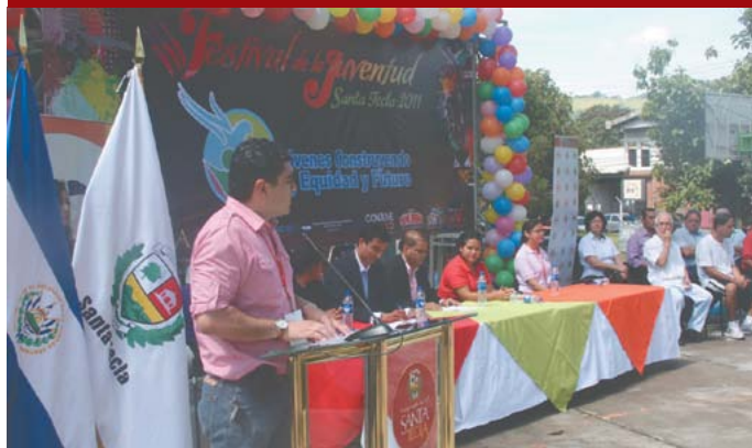
Festival de la juventud 2011.