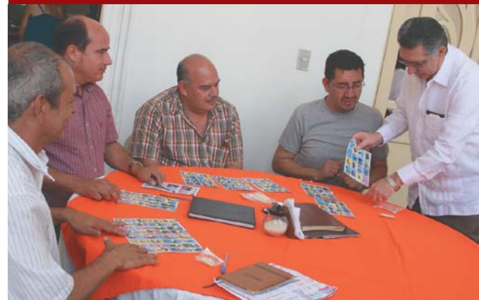
Más de 100 municipios participaron en la Lotería Pueblos Vivos.