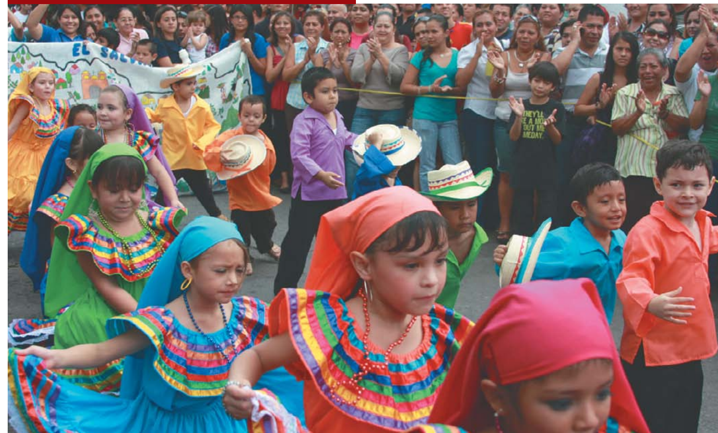
Creación de espacios de expresión para la niñez teclena.

El 2012 establece nuevas apuestas en materia de participación ciudadana, dando seguimiento al fortalecimiento del Consejo Ciudadano para el Desarrollo Local y las 12 mesas sectoriales, con la finalidad de seguir abriendo espacios para una ciudadanía cada vez más organizada, con mayores niveles de exigencia y compromiso con el diseño de cambio de la ciudad.