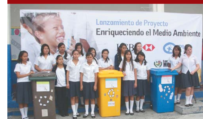
Lanzamiento del Proyecto de reciclaje Enriqueciendo el Medio Ambiente.