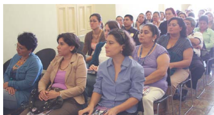
Foros y encuentros sobre equidad de género.

El Gobierno Municipal de Santa Tecla y la Red Latinoamericana Prologo, a través del Programa de las Naciones Unidas (PNUD) ejecutaron el proyecto "Propuesta Locales de Gobernabilidad",