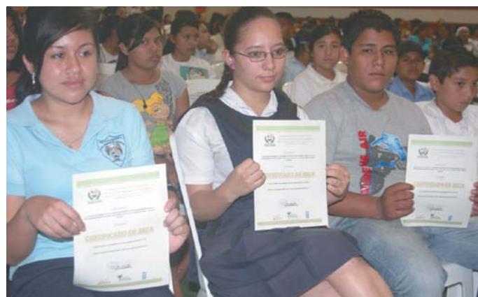
Programa Beca- Escuela.

La proyección del arte y la cultura ha sido también una de las grandes apuestas. Con la ampliación de la oferta del proyecto del Paseo El Carmen, los Festivales de Puertas Abiertas, exposiciones, talleres y actividades de promoción de la cultura, seguimos en la ruta de consolidarnos como un referente de la cultura y el turismo.