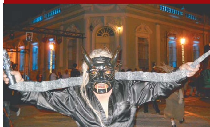
Expresiones artísticas culturales con enfoque.

con la idea de fortalecer la gobernabilidad democrática en el municipio, para contribuir al Desarrollo Humano a través del empoderamiento de la sociedad civil en el análisis de las condiciones de gobernabilidad y la formulación de propuestas de acción para su mejoramiento.