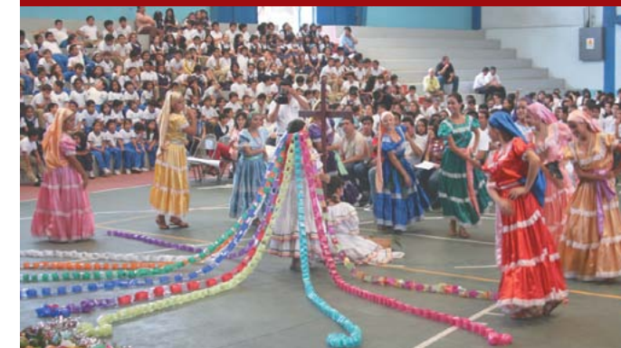
Celebración del Día de la Cruz.