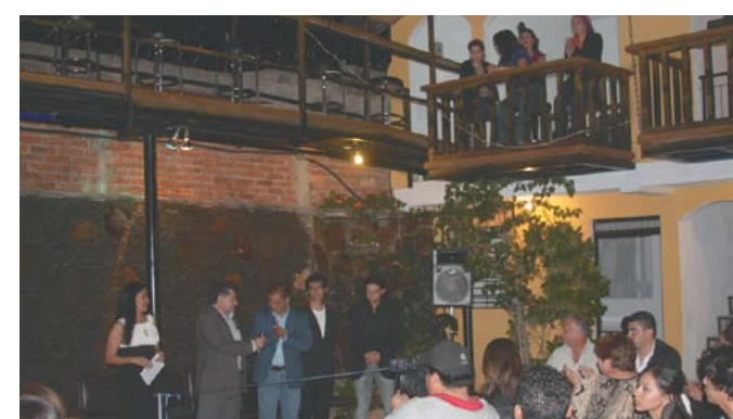
Inauguración del Bar El Quijote.