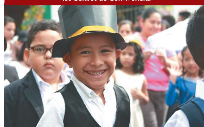
Espacios de desarrollo para la niñez.

los servicios que presta la municipalidad. Además se cuenta con equipo de primera mano para atender emergencias y computadoras.