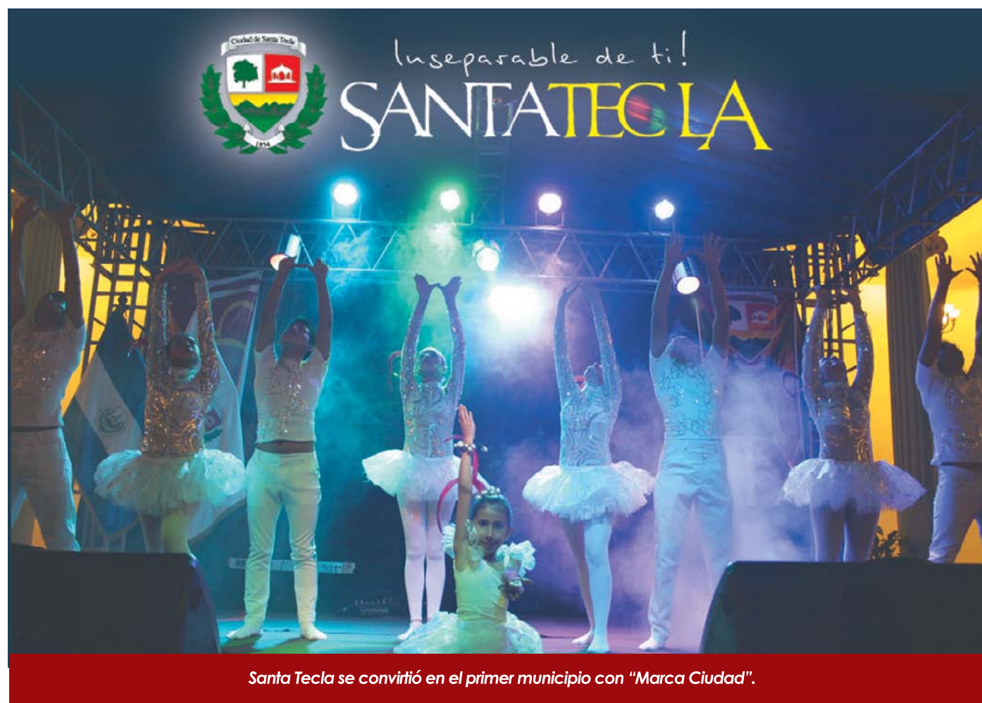
Santa Tecla se convirtió en el primer municipio con "Marca Ciudad".

y, que permite, no solo un mejor manejo de las comunicaciones, sino también una proyección más clara, más atractiva y de mayor impacto para el modelo implementado en Santa Tecla. La marca ciudad de Santa Tecla es: "Inseparable de Ti, Santa Tecla, tu ciudad". Este mensaje permite desarrollar toda una serie de actividades, tanto periodísticas, como publicitarias y de RRPP, que incluyen alianzas estratégicas y un mapa claro de como conectar el accionar de la administración con los diferentes públicos. Es de hacer notar que, como marca ciudad, definida como tal y que responde a una estrategia bien estructurada, la marca: "Inseparable de Ti, Santa Tecla", es la primera de su condición y naturaleza en el país, y una de las primeras en la región; esto, sumado a los cambios que inicialmente fueron mencionados, ubican al municipio entre los de mayor crecimiento y dinamismo en el istmo centroamericano y uno de los de mayor riqueza política y cultural en la región mesoamericana.