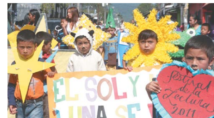
La niñez participa en actividades de fomento educativo.