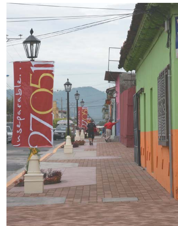
Novedoso proyecto de recuperación del espacio público de la ciudad.