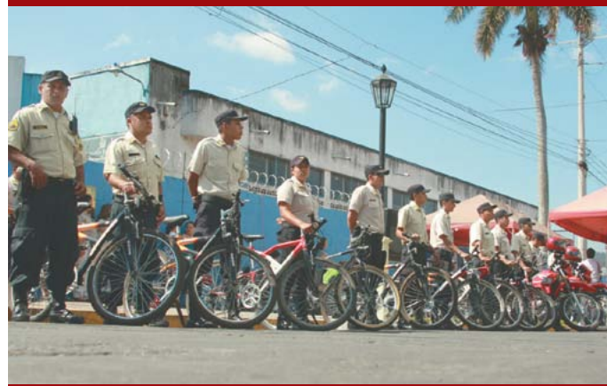
Patrullajes permanentes en alrededores de centros educativos.