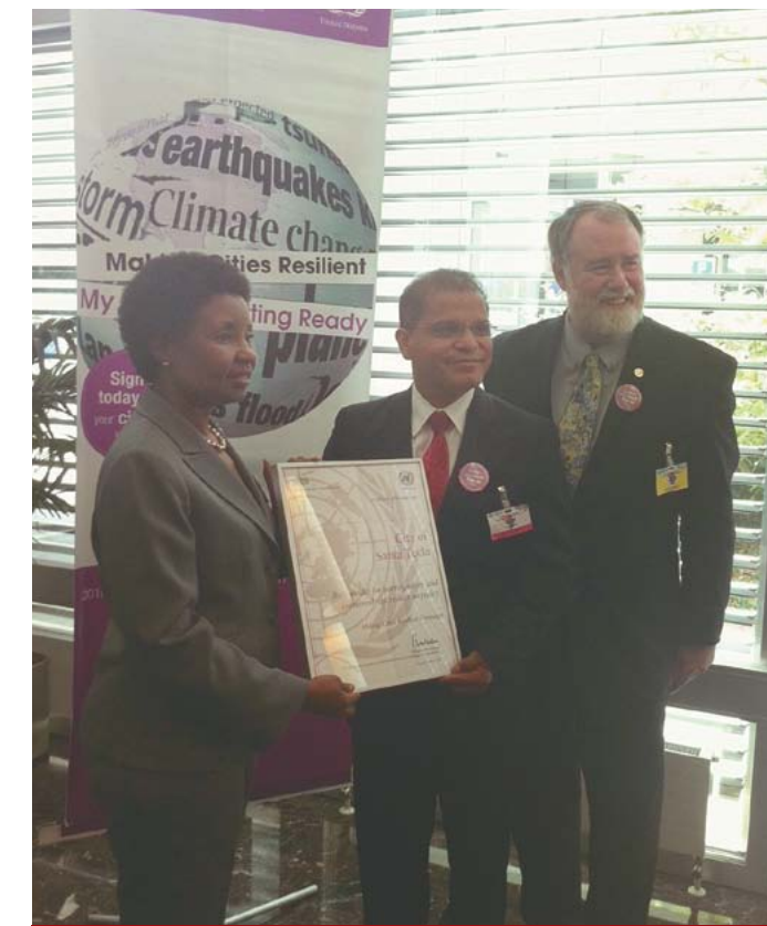
Entrega de reconocimiento a Santa Tecla como ciudad resiliente en el marco de la 65 Asamblea General de la ONU sobre reducción del riesgo a desastres.