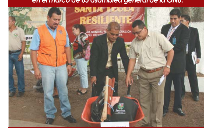
Entrega de equipo a Comités de Emergencia Local.