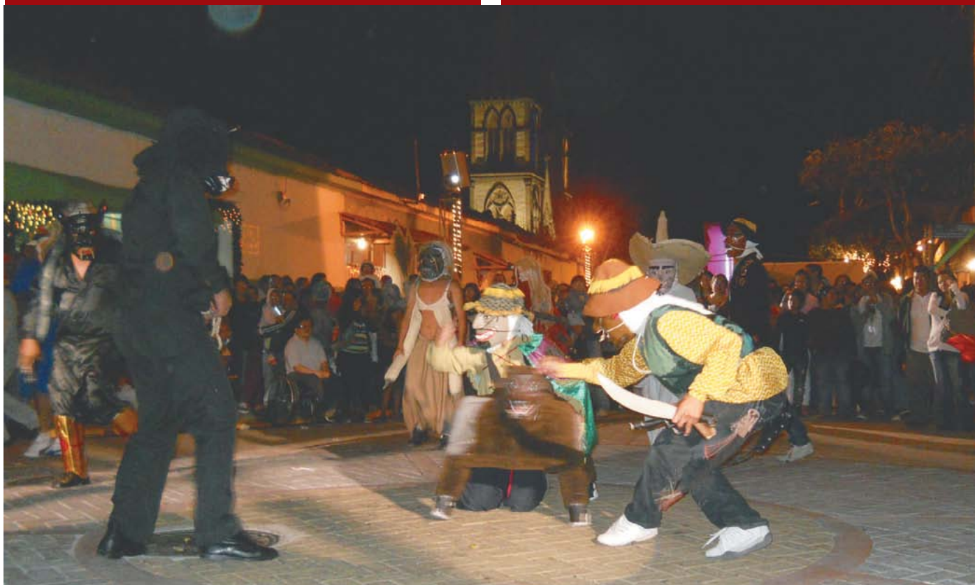
Actividades artísticas en Paseo El Carmen.