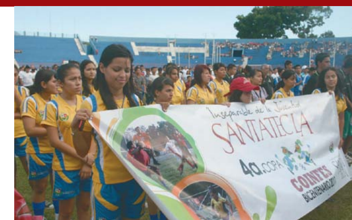
Participación en la 4ª Copa Internacional de Fútbol de El Salvador.