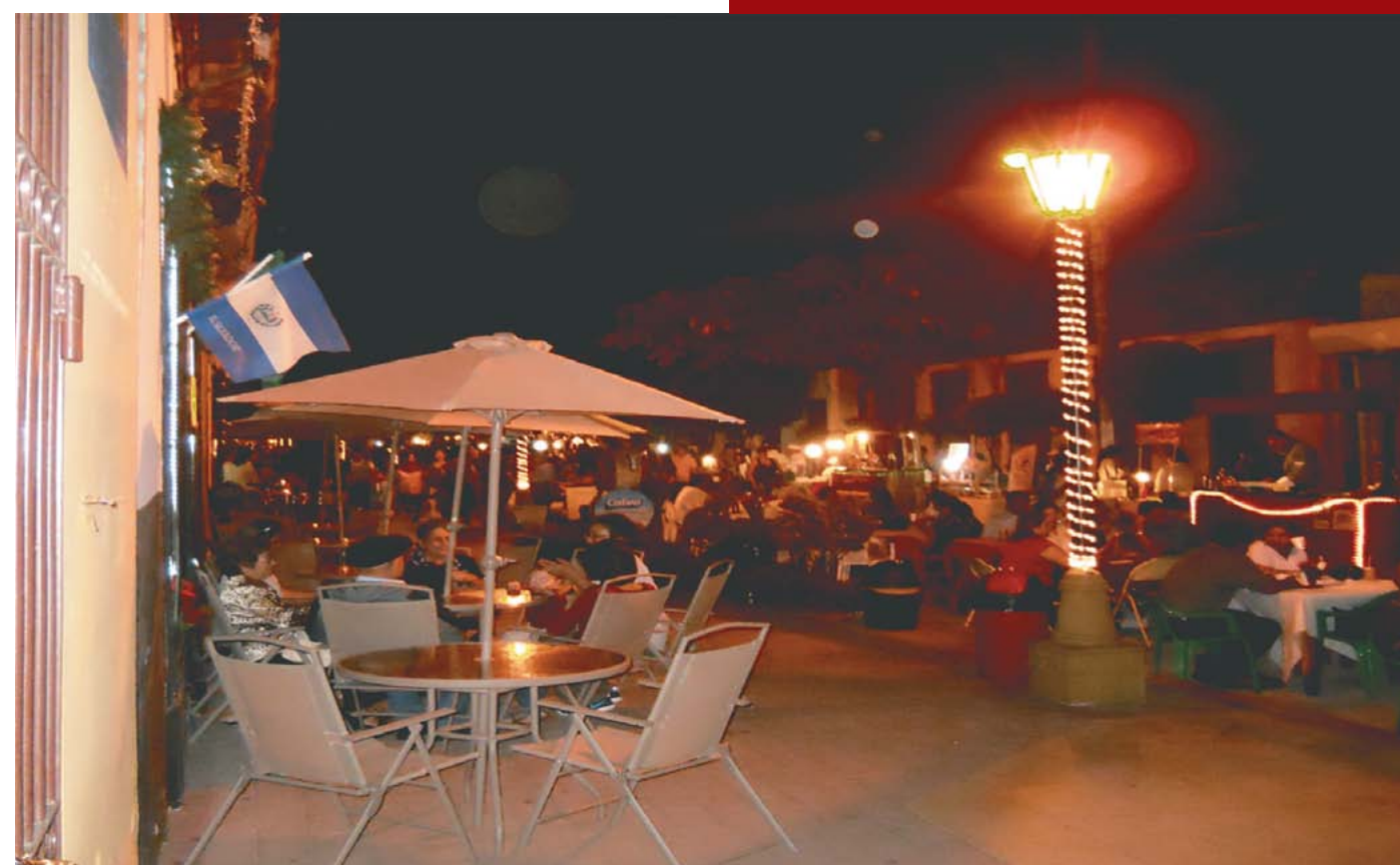
Festival de Puertas Abiertas en Paseo El Carmen.