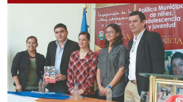
Presentación de Política de niñez, adolescencia y juventud.