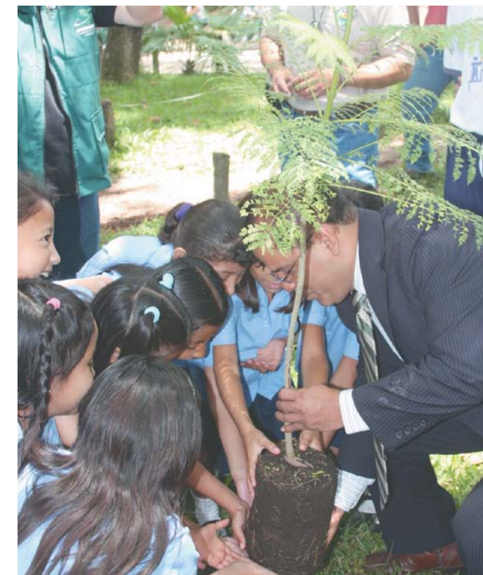
Campaña de reforestación en El Cafetalón.