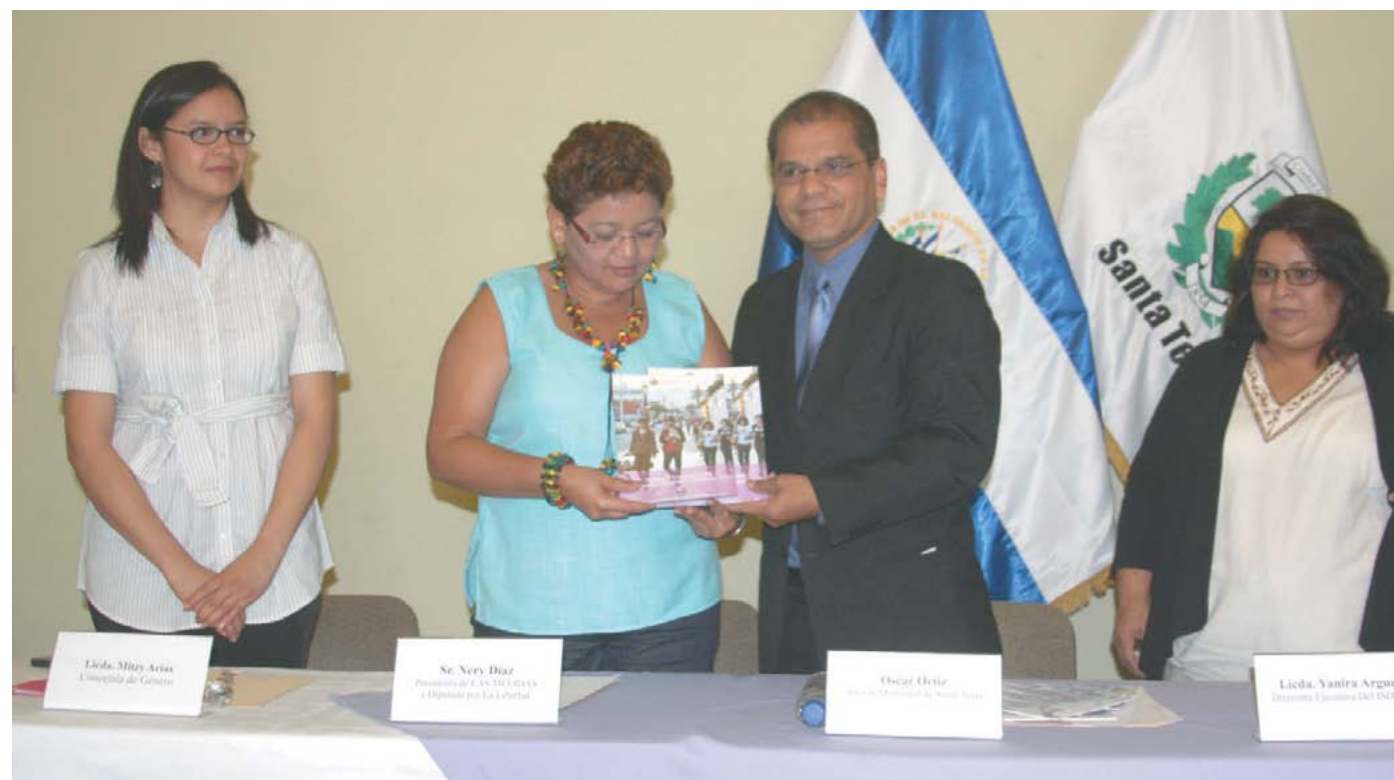
Presentación de actualización de la Política Municipal para la Equidad de Género.

Desde nuestra visión hemos visto necesidad de apostar a un estilo de gobierno local concertador, dialogante y articulador del ejercicio público. Hemos abierto las puertas a la participación ciudadana para la toma de las grandes decisiones y la puesta en marcha de temas claves para el desarrollo del municipio.