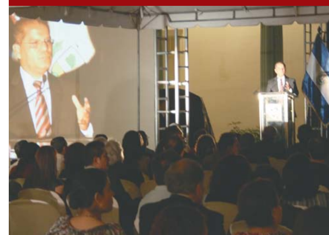
Alcalde Ortiz presenta marca "Inseparable de Ti".