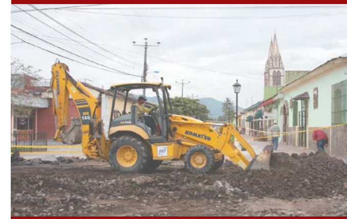
Construcción de cruz calles en Paseo El Carmen.