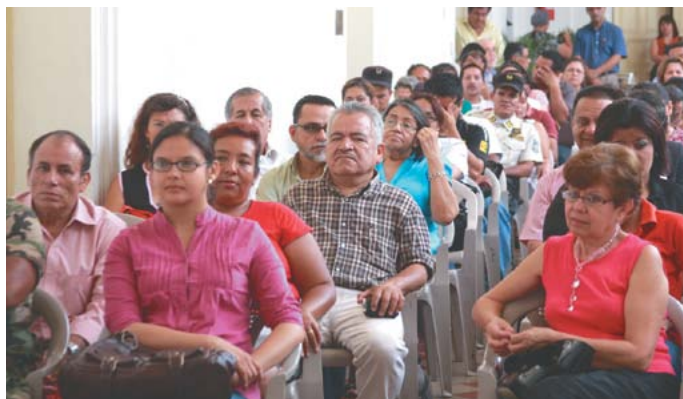
Formación de líderes y lideresas en el municipio.