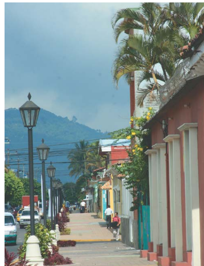
Reforma urbana en el Centro Histórico del municipio.