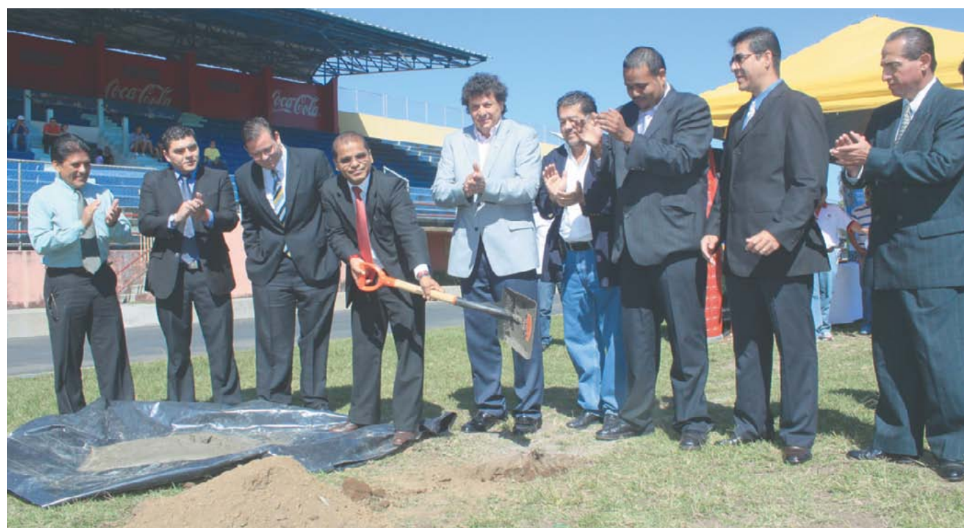
Inicio de trabajos de remodelación del Estadio Las Delicias.

dos, desde que nació, en el año 2007. Además siempre la Consejería y el Departamento de Recreación mantiene relaciones directas de trabajo con escuelas deportivas de Fútbol, Baloncesto, Karate Do, Patinaje, Aeróbicos, Sóftbol; torneos Deportivos de Colonias y Cantones, etc. También estamos transformando el Estadio Municipal Las Delicias en un escenario deportivo de primer nivel, desde donde se continuará promoviendo la práctica deportiva.