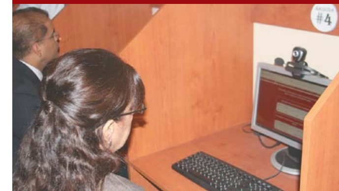
Santa Tecla primera ciudad digital del país.