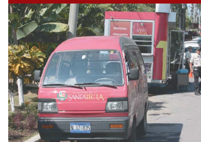
Difusión de la "Marca Ciudad".