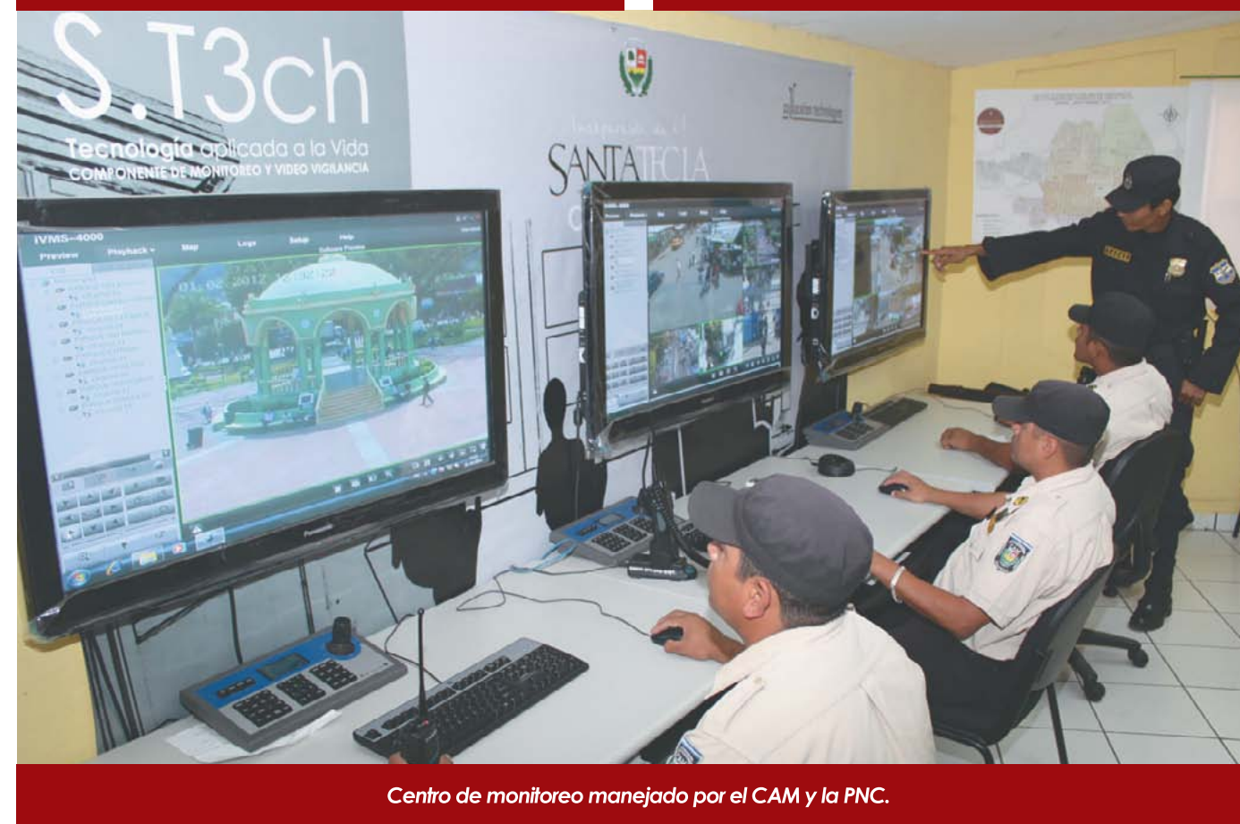
Centro de monitoreo manejado por el CAM y la PNC.