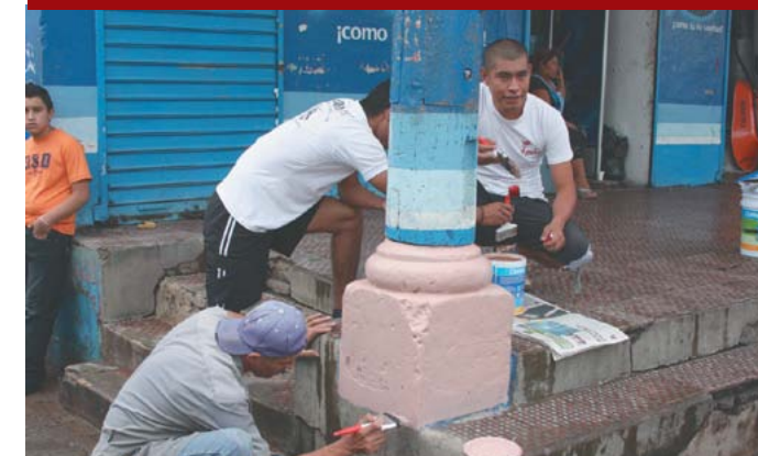
Campaña de recuperación y limpieza de los portales.