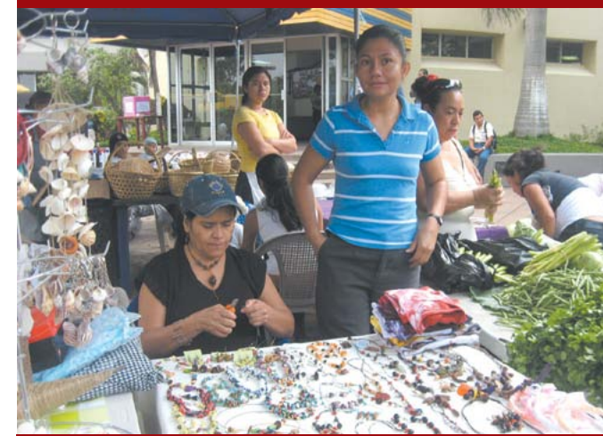
Ferias de emprendedurismo.