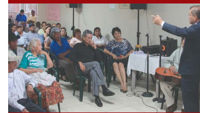
Visita a centro de atención de FUSATE.