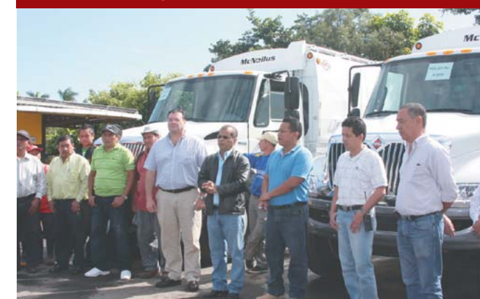
Adquisición de nuevos camiones compactadores.