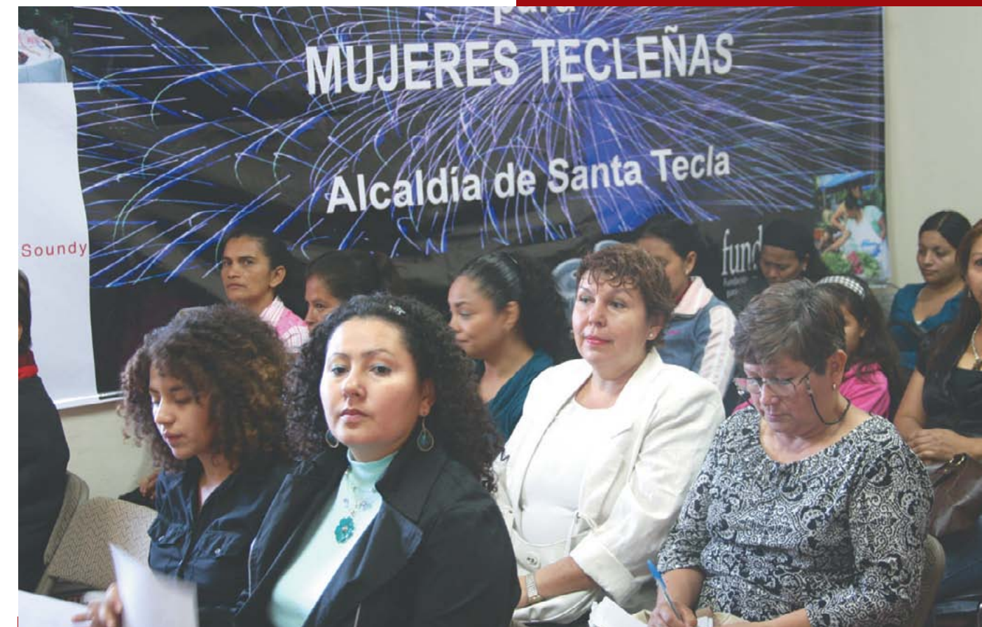
El sector de mujeres es uno de los más dinámicos y participativos del municipio.