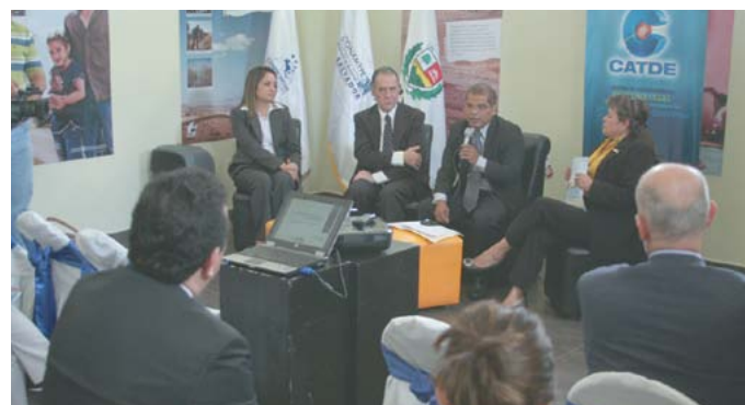
Relanzamiento del Centro de servicios tecnológicos para el desarrollo empresarial.

Así mismo, se pusieron en funcionamiento nuevos establecimientos en el Paseo El Carmen y el Festival de Puertas Abiertas que permite a los emprendedores locales impulsar sus productos.