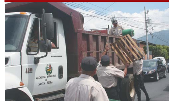
Operativo de decomiso de obstáculos en Ciudad Merlot.