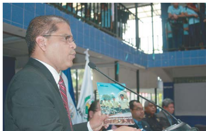
Presentación 3ª Actualización de la Política de Seguridad.