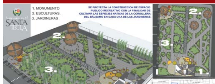
Proyecto Las Colinas 13 de Enero.