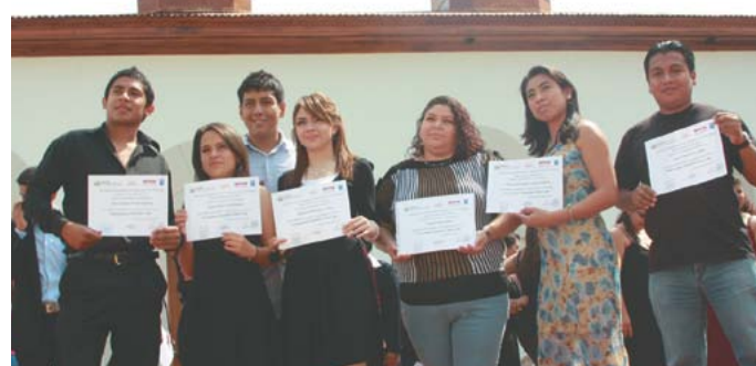
Entrega de becas vocacionales.