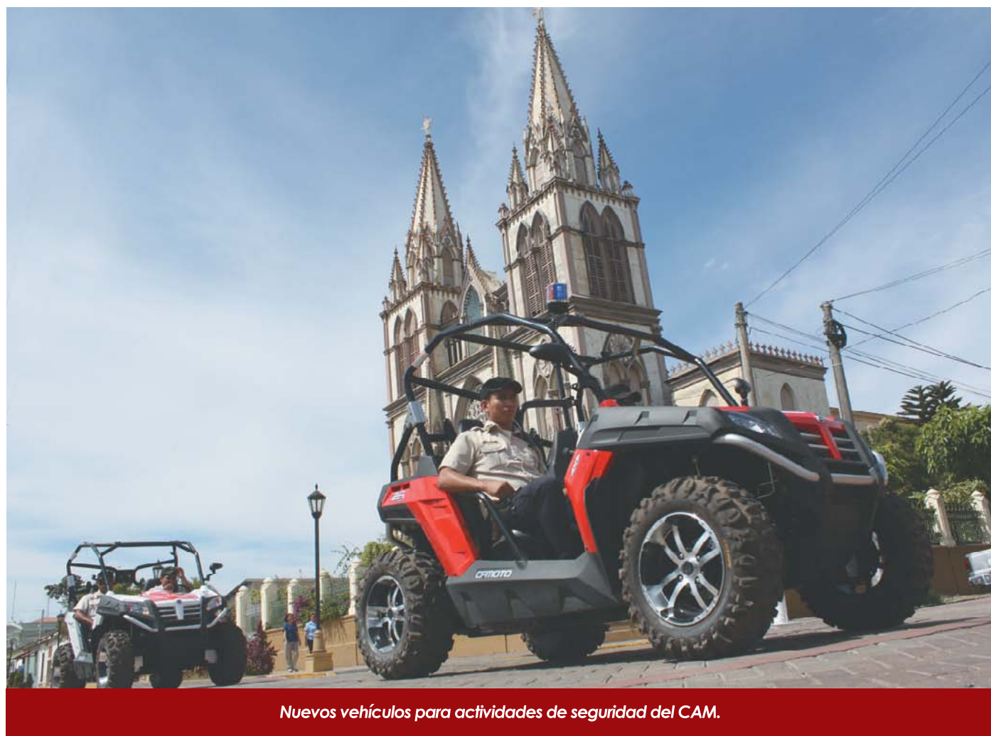
Nuevos vehículos para actividades de seguridad del CAM.

En octubre, el impacto de la Depresión Tropical 12 E puso a prueba la resiliencia del territorio Tecleno, que respondió de manera ágil e inmediata, con el apoyo ciudadano, la mano solidaria de nuestros cooperantes y el acompañamiento de la empresa privada, sabiendo sobreponerse e iniciando una nueva etapa de reconstrucción.