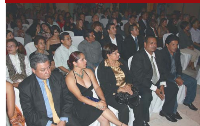
Presentación de Marca Ciudad.