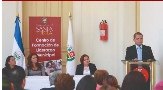
Apertura y funcionamiento del Centro de Liderazgo Municipal.

En estos espacios se reciben demandas sobre