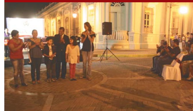
Inauguración de cruz calles en el Paseo el Carmen.