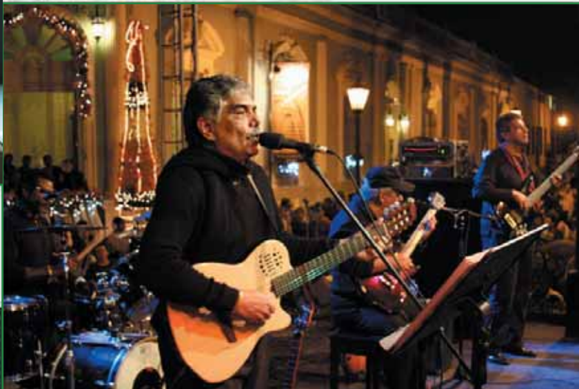
Concierto de Los Guaraguo frente al Palacio Municipal