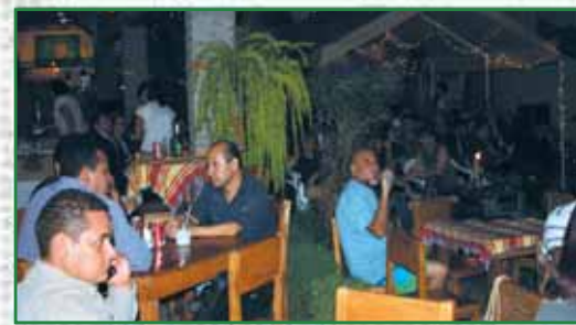
Bar Entre Ríos en casa de las MIPYMES

Iniciativas importantes como el Programa Beca Escuela, Programas de Alfabetización, los Centros de Atención Integral y la buena coordinación a nivel interinstitucional nos perfilan como uno de los municipios con mayor calidad y oportunidades educativas para todos los sectores del municipio.