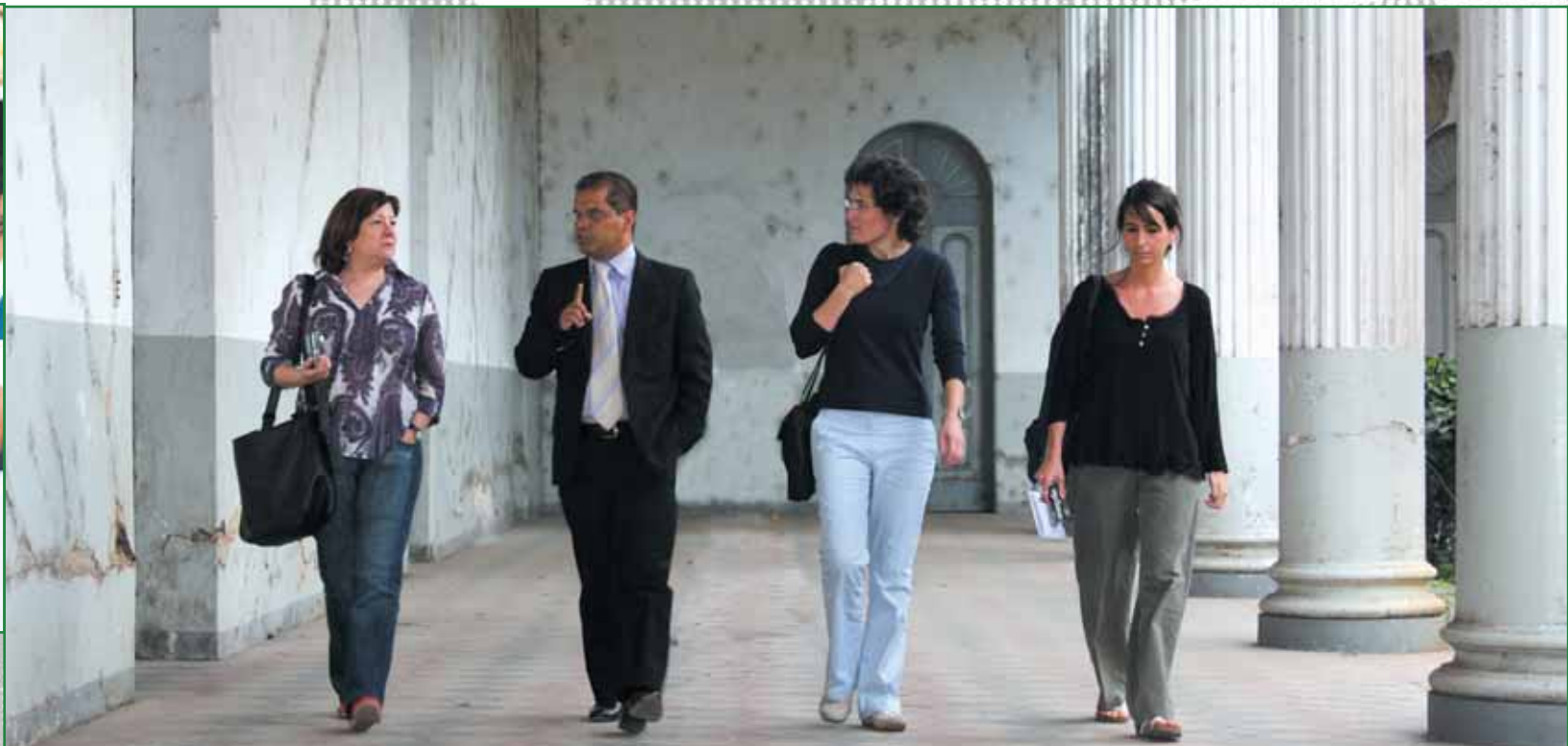
Visita de delegación del Ayuntamiento de Barcelona, Hogar del Niño Adalberto Guirola