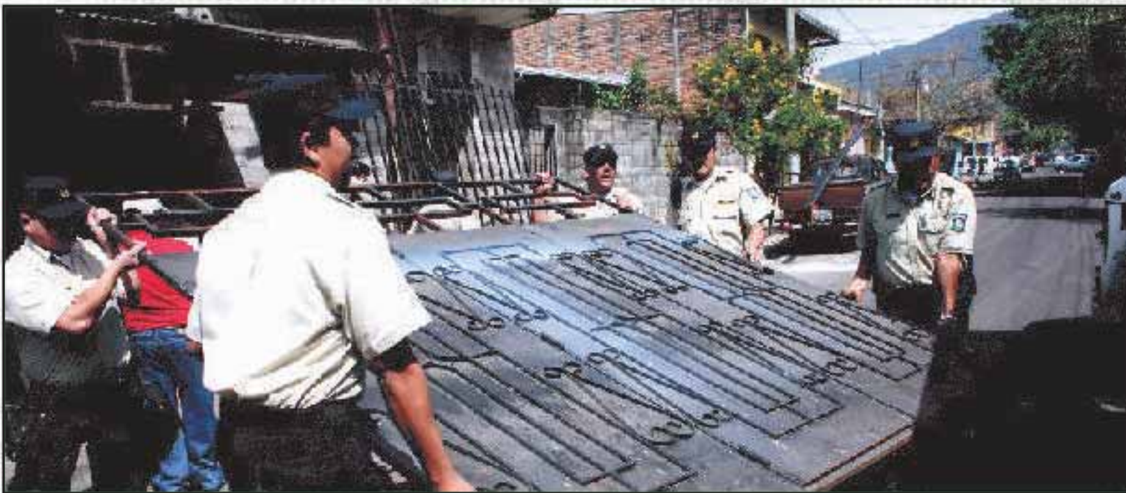
Agente del CAM en tareas de seguridad y orden como parte del plan "Tranquilidad Ciudadana"