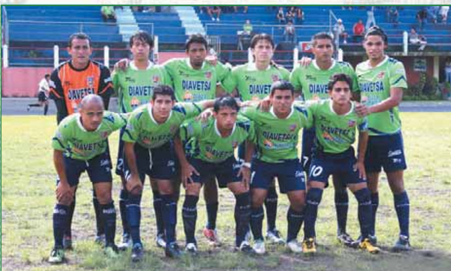
Santa Tecla F.C

Formado en 2007, en su primer año de competir en la Segunda División del fútbol profesional, fue el equipo revelación del Torneo Apertura de ese año. El Santa Tecla Fútbol Club es la gran apuesta que nuestro Gobierno Local tiene para aportar al fútbol de Primera División y potenciar la identidad deportiva del municipio