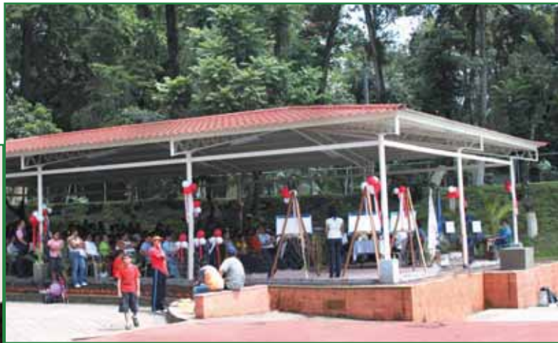
Inauguración Ranchón en Centro Deportivo El Cafetalón