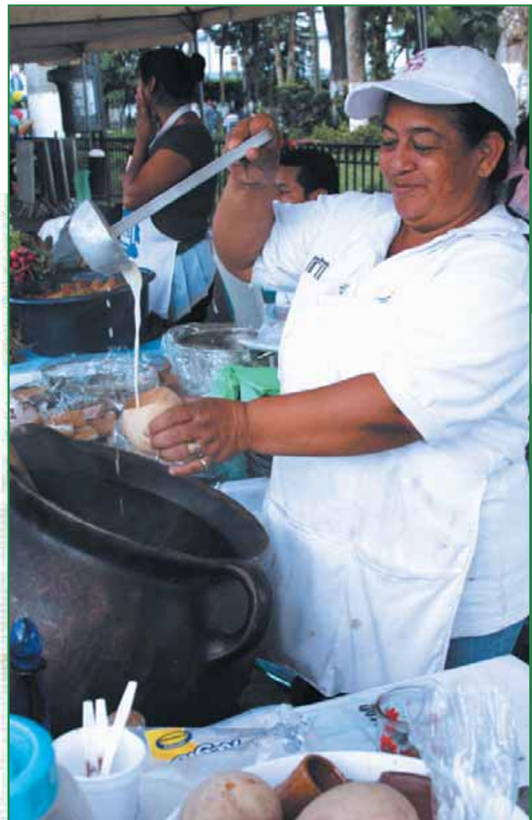
Microempresaria elaborando ponche en el Día de la Mujer Rural