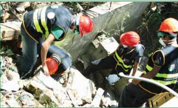
Simulacro en Cantón Los Amates