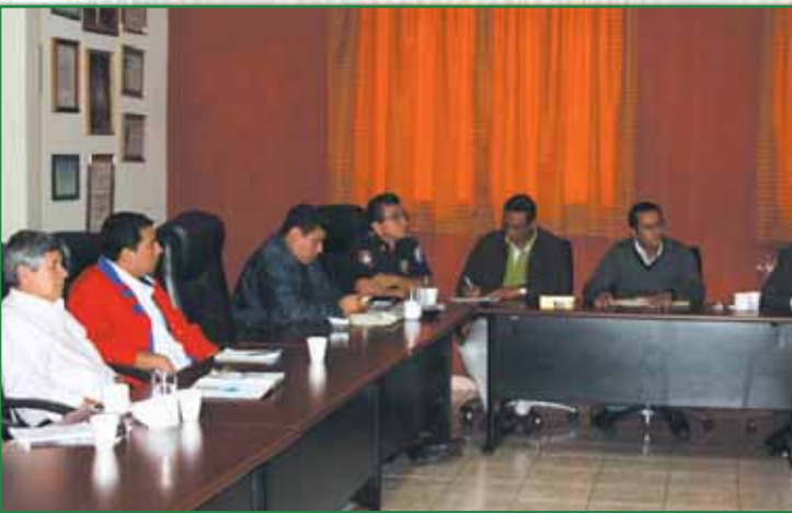
Consejo Interinstitucional para la Prevención de la Violencia.