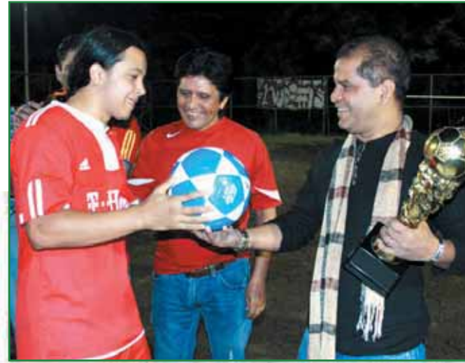
Autoridades clausuran Torneo de Fútbol en Parque Ecológico San José