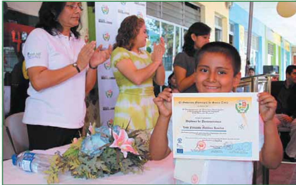
Graduación de alumnos del Centro de Atención Integral (CAI) en Mercado Dueñas

El voluntariado juvenil trabaja en áreas concretas como son las campañas de prevención del VIH, el programa de alfabetización, y otros ejes de trabajo que le han permitido a nuestro Gobierno Local posicionarse a nivel nacional como un verdadero modelo de cambio.