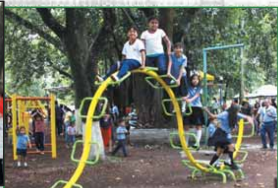
Inauguración de Juegos Infantiles en El Cafetalón

En este año se ha continuado apostando al protagonismo de la juventud como una de las fuerzas vivas de nuestra querida Santa Tecla, es por ello que la municipalidad ha realizado una serie de actividades y proyectos con el objetivo de incentivar a la juventud teclena a que brinden su aporte en los procesos de cambio de nuestra ciudad.