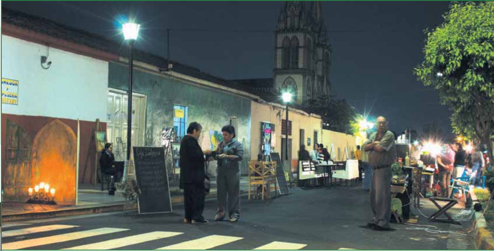
Festival Puertas Abiertas en El Paseo El Carmen

La apuesta por hacer de Santa Tecla un municipio que abra las puertas al mundo del saber a la familia tecleña continua siendo uno de nuestros ejes estratégicos; así como lo es hoy en día la proyección de las tradiciones, el patrimonio, la identidad y las expresiones artísticas hacia el mundo. El gran reto es día a día abrir más oportunidades de educación y hacer resplandecer nuestra historia, a través de la construcción de una Santa Tecla más educativa y cultural.