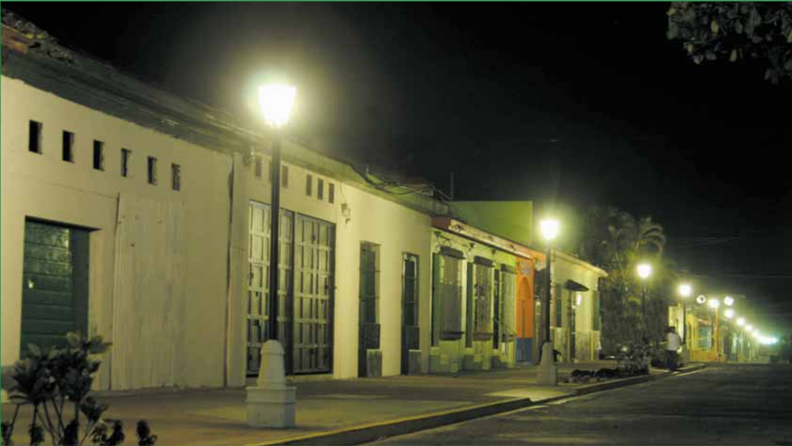
Paseo El Carmen