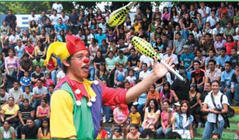
Segundo Festival de la Juventud, El Cafetalón.

Con tan solo un año de trabajo, el Consejo Juvenil Teclño en coordinación con nuestro Gobierno Local y empresas privadas realizó el Segundo Festival de la Juventud; con la finalidad de abrir espacios a las y los jóvenes de nuestro municipio para que participen en temas de interés social y de beneficio para todas las comunidades de nuestra ciudad.