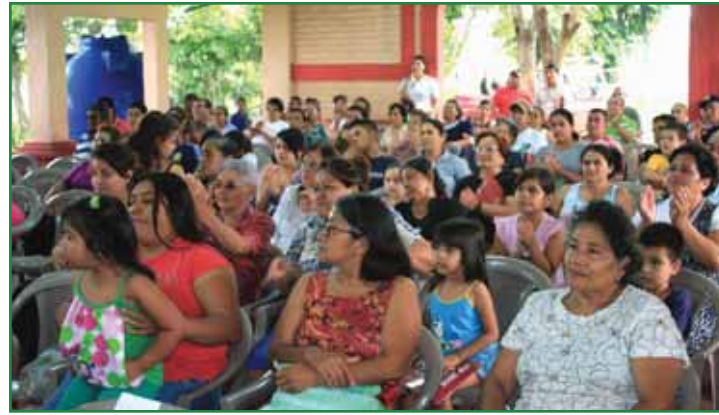
Inauguración de Centro Integral de Cultura y Convivencia Ciudadana en Equidad, Monte Tabor, Merliot.

Como parte de estos proyectos fueron equipados y adecuados los espacios comunitarios de las Colonias San Antonio, Las Delicias, Monte Tabor en Ciudad Merliot, comunidad El Progreso y los cantones El Matazano y El Progreso, con una inversión superior a los $100,000.00.