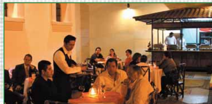
Inauguración del Café Museo