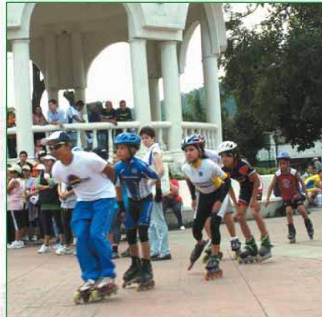
Escuela municipal de patinaje en Parque Daniel Hernández