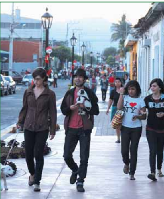
Paseo El Carmen Fase II

En 2010 hemos iniciado con éxito el ambicioso proyecto de reforma urbana de nuestro querido municipio, por medio del rescate del espacio público, para renovar la imagen y dar un nuevo brillo al rostro de Santa Tecla, avanzar en la ruta de la modernización y elevar el nivel de desarrollo.