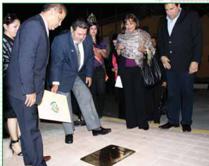
Autoridades Municipales y la empresa privada participan en la develación de placa en El Paseo El Carmen, fases III y IV.

El mejoramiento de nuestros espacios recreativos y de sano esparcimiento para nuestra niñez y juventud, la seguridad, la reparación de la red vial, la educación, la proyección de nuestra cultura y el turismo son algunas de las áreas que se han fortalecido con el apoyo de los diferentes ministerios y entidades del Gobierno Central .