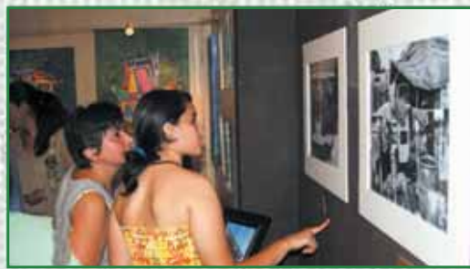
Exposición en Restaurante Yemayá