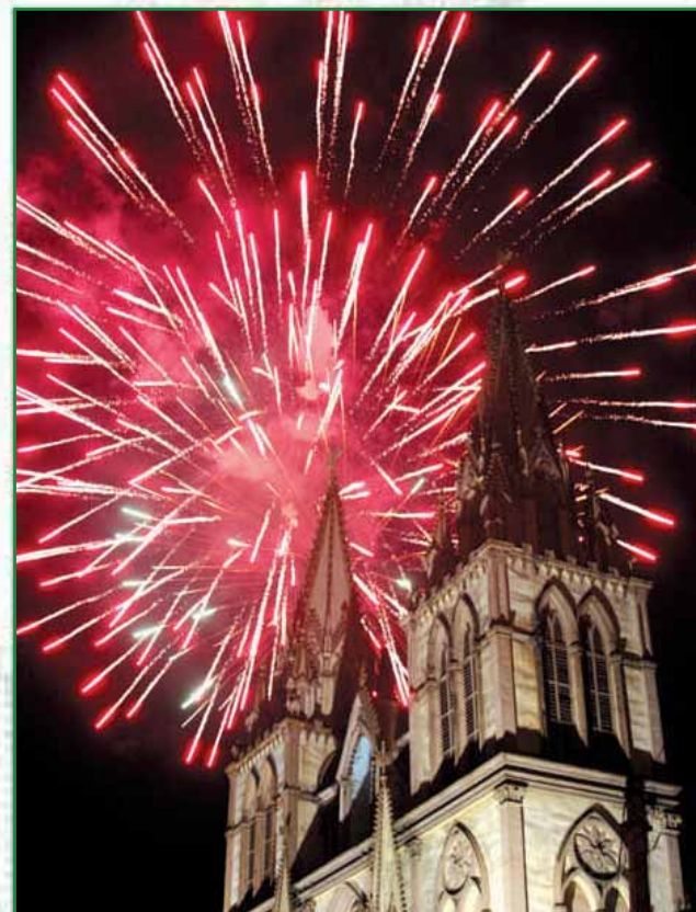
Show de Luces en el Paseo El Carmen