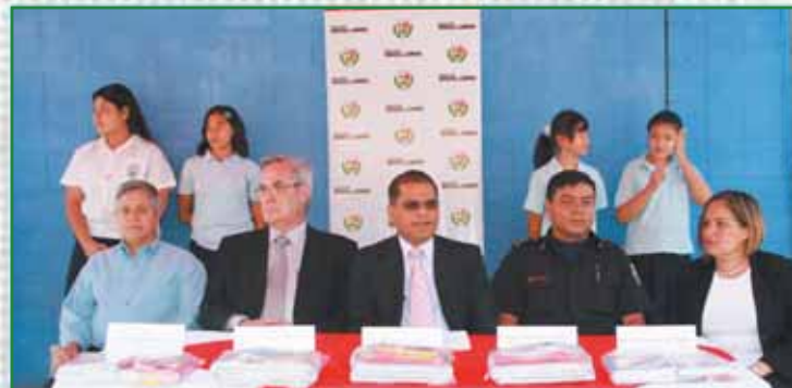
Lanzamiento Plan Escuela Segura

De igual forma, la apertura del Museo Tecléño nos convierte en los primeros en poner a disposición de las familias un museo municipal de fomento de la cultura de paz y rescate de los valores que nos identifican como tecléños y tecléñas. Esta iniciativa, unida al funcionamiento del Palacio de la Cultura y las Artes, la construcción del Paseo El Carmen y la puesta en marcha de talleres artísticos, nos permitirá, muy pronto, conectar a nuestro Centro Histórico en un Distrito Cultural y abrir una nueva puerta para posicionarnos, además, como una nueva oferta turística.