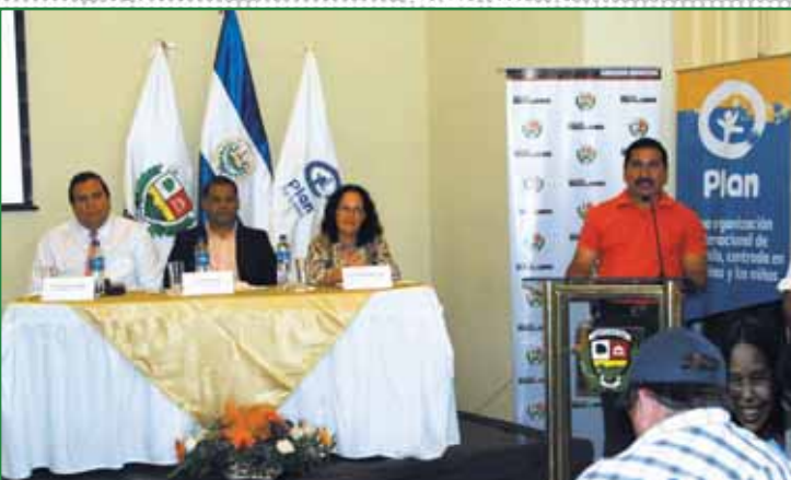
Alcaldes Municipales del Departamento de La Libertad y Plan El Salvador implementan iniciativas de gestión de riesgos