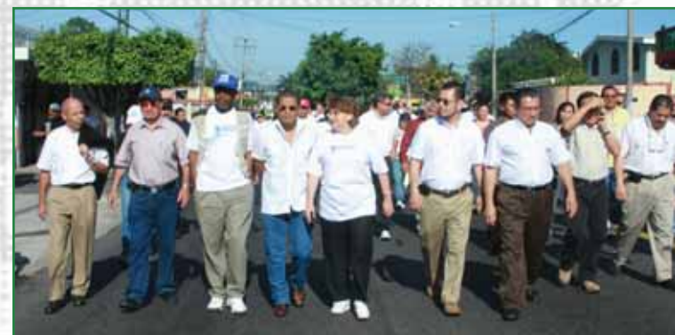
Alcalde Ortiz junto a Autoridades Gubernamentales y de la OPS participan en caminata del Día Mundial de la Salud.