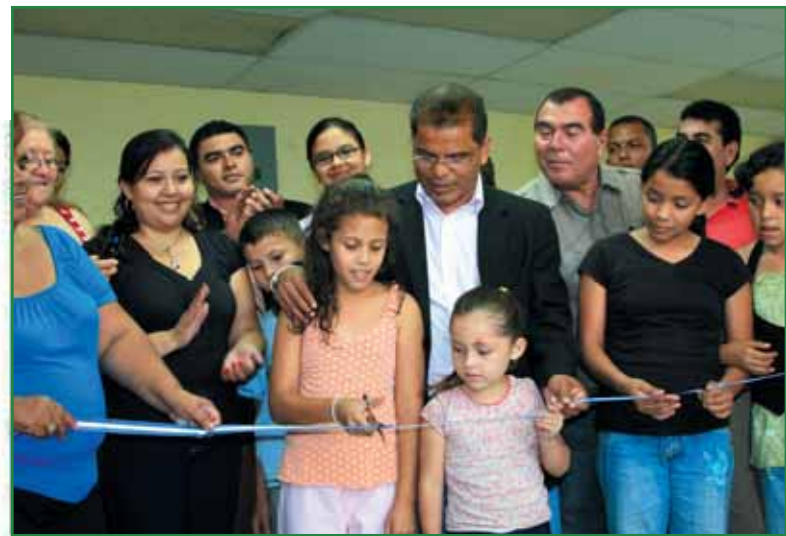
Inauguración de Centro Integral de Cultura y Convivencia Ciudadana en Equidad, Monte Tabor, Merliot.