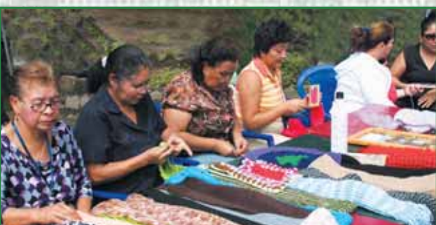
Mesa de Adultas Mayores en Feria de Emprendedurismo

En el 2010 seguimos fortaleciendo este proceso participativo, tomando en cuenta las inquietudes y demandas de la gente, dando pasos firmes, sobre todo en el área de la descentralización.