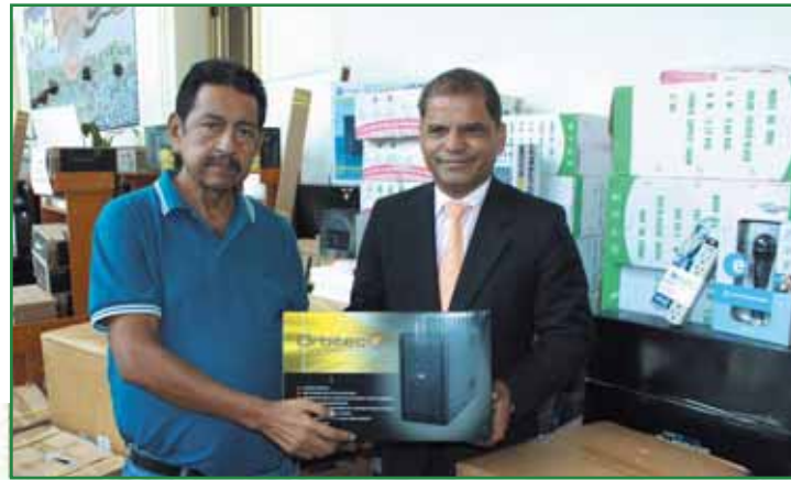
Entrega de equipos para Centros Integrales de Cultura y Convivencia Ciudadana en Equidad.

Los espacios de Monte Tabor en Ciudad Merliot y Colonia San Antonio fueron los destinados para realizar la descentralización de servicios municipales como alumbrado público, poda de árboles, bacheo, recolección de desechos, atención a denuncias y demandas ciudadanas.