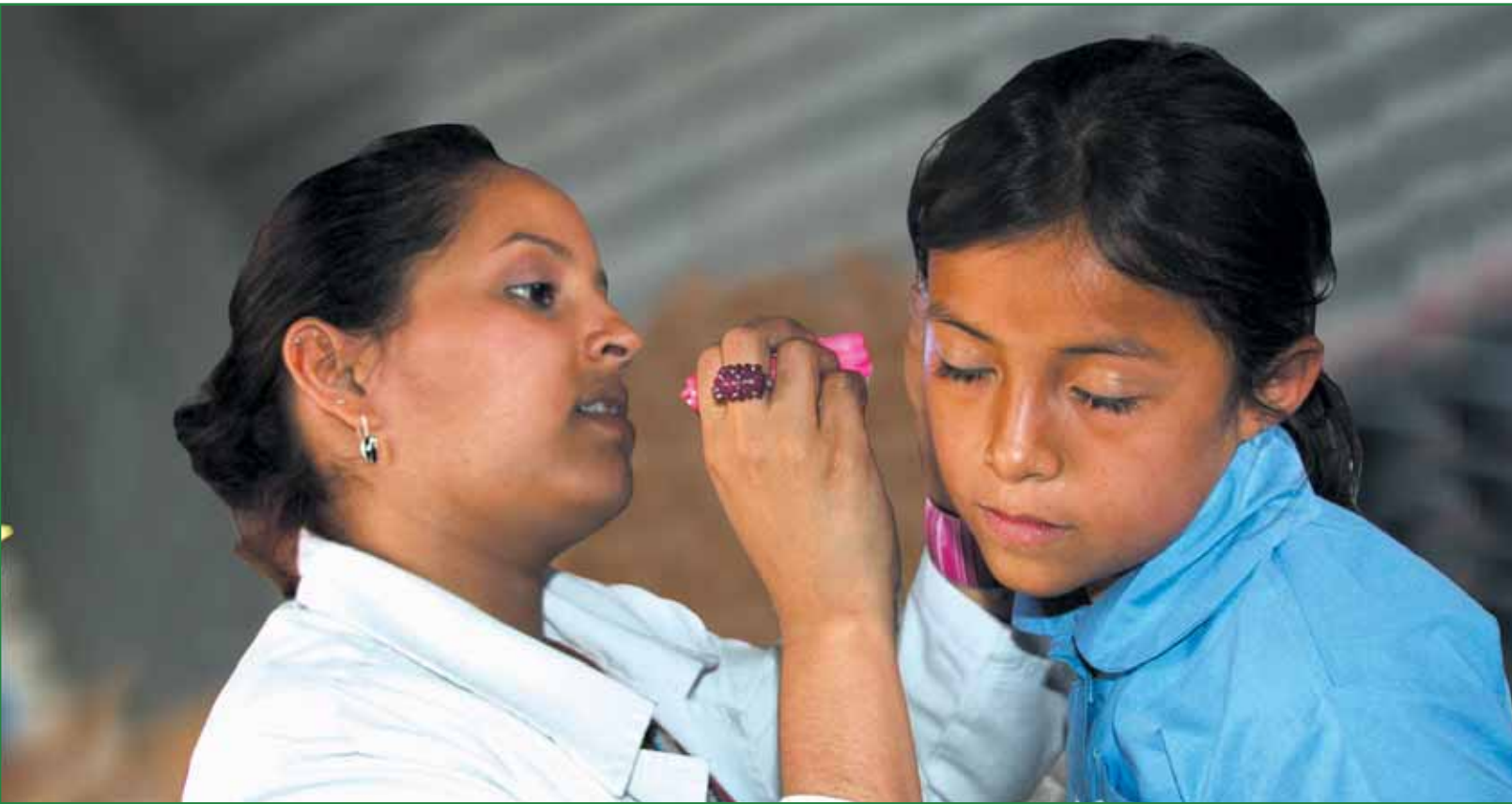
Brigadas Médicas en comunidades del municipio.

Durante todo este año el Gobierno Local en coordinación con la ciudadanía realizó campañas de limpieza integrales en las diferentes comunidades del municipio. También han continuado en funcionamiento las plantas de reciclaje y compostaje, lo que permite un manejo más adecuado de los desechos.