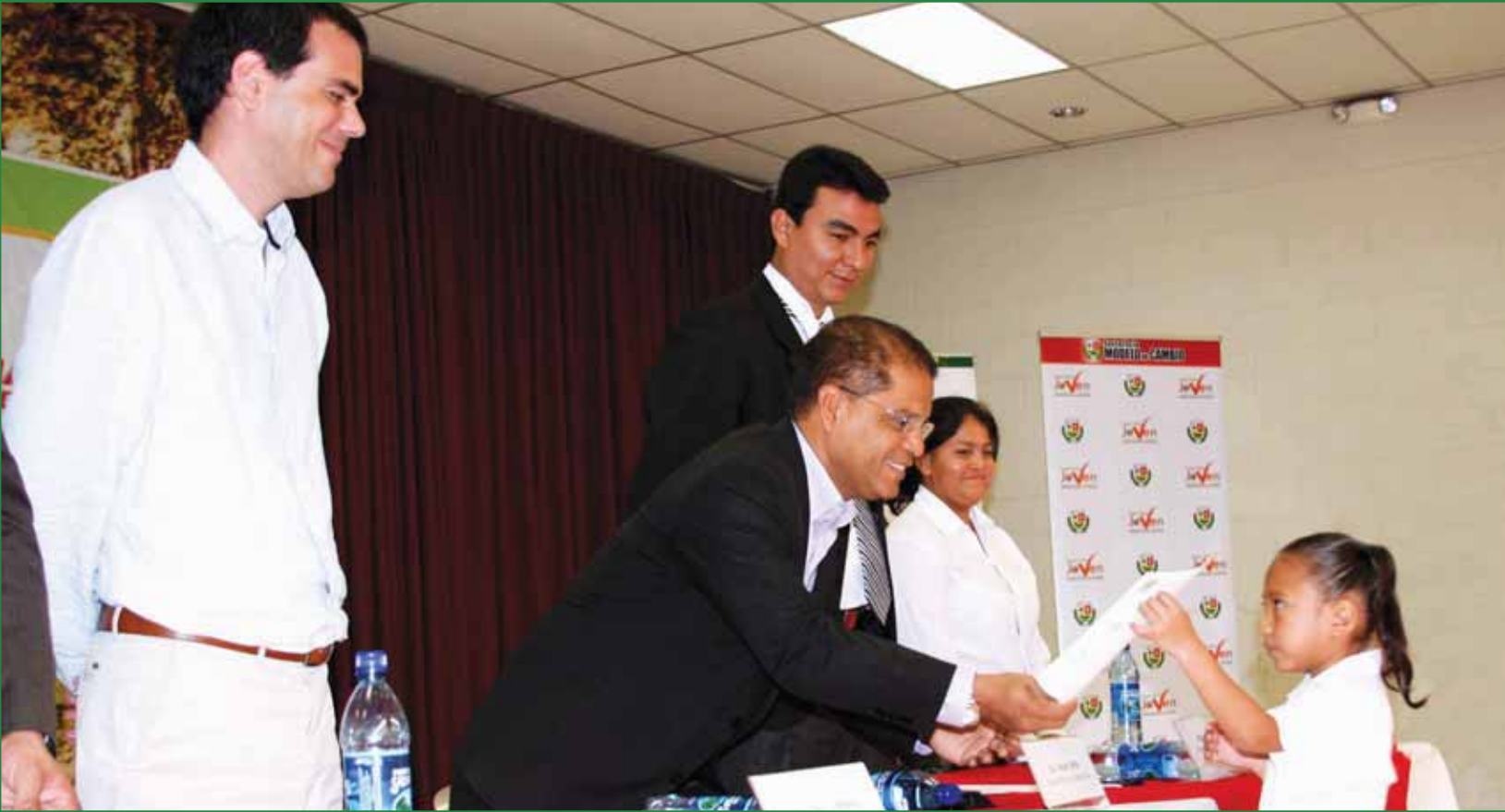
Lanzamiento del Plan Beca Escuela 2010.