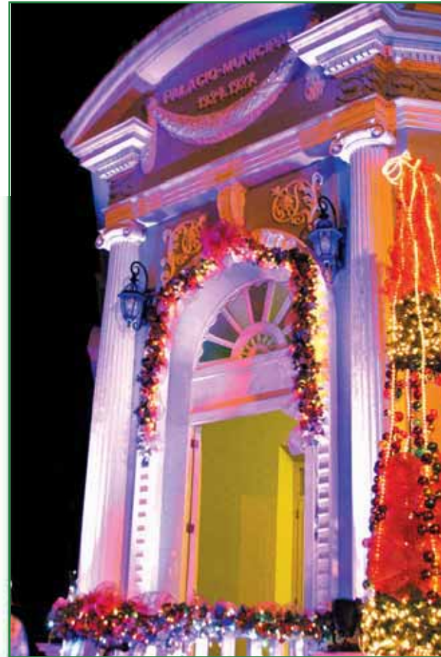
Iluminación Palacio Tecléño de Cultura y las Artes