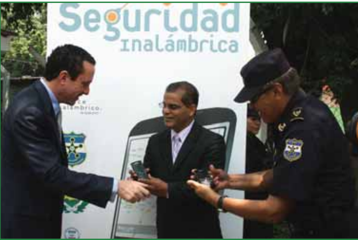
Lanzamiento del proyecto Seguridad Inalámbrica