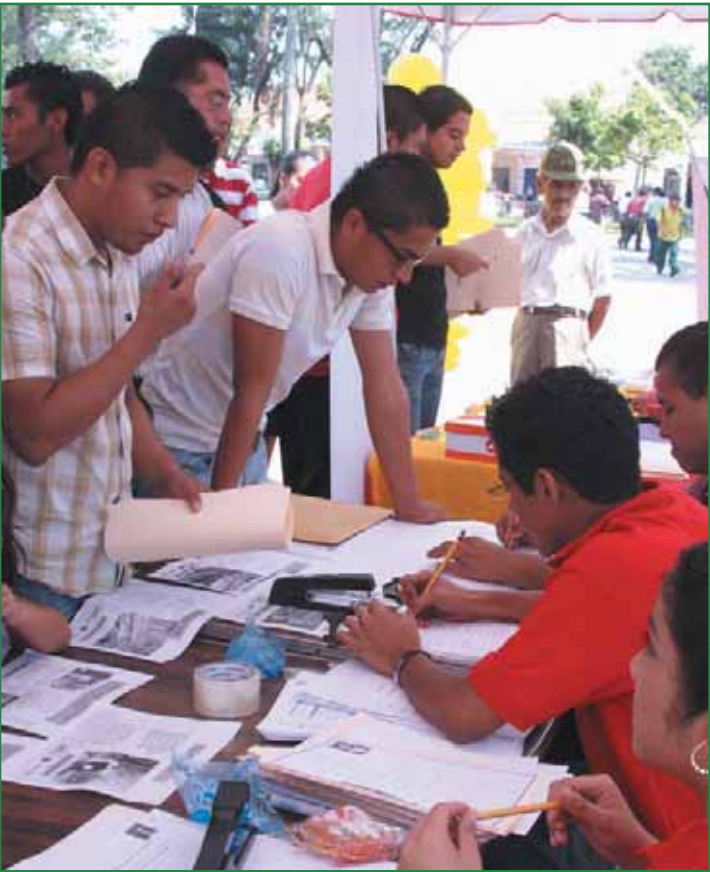
Feria del Empleo realizada en Parque Daniel Hernández

Como parte de este trabajo se realizó la segunda feria municipal de empleo, la inauguración del Centro de Asesoría Tecnológica para el Desarrollo Empresarial, que busca dinamizar la economía de la familia tecleña mediante la incorporación de las tecnologías de la información y comunicaciones en las micro y pequeñas empresas locales, además se ha brindado apoyo a la agricultura local y se fomenta el emprendedurismo.