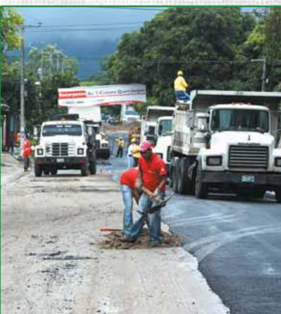
Recarpeteo Colonia Quezaltepec