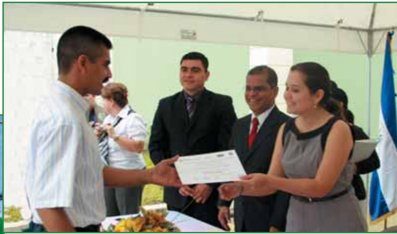
Graduación de cursos vocacionales ITCA proyecto "Ciudad Segura para Convivir"