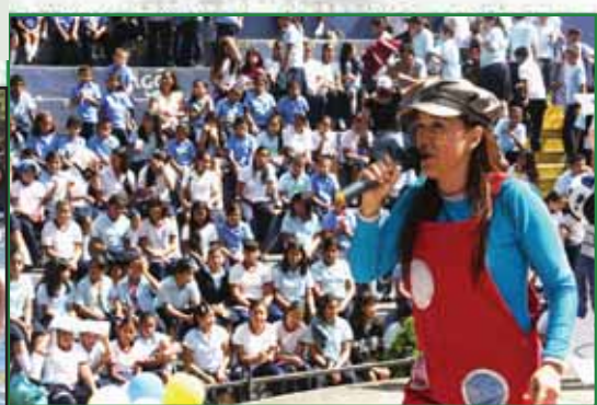
Presentación de la Tia Bubu durante la celebración del Festival de la Niñez, El Cafetalón.