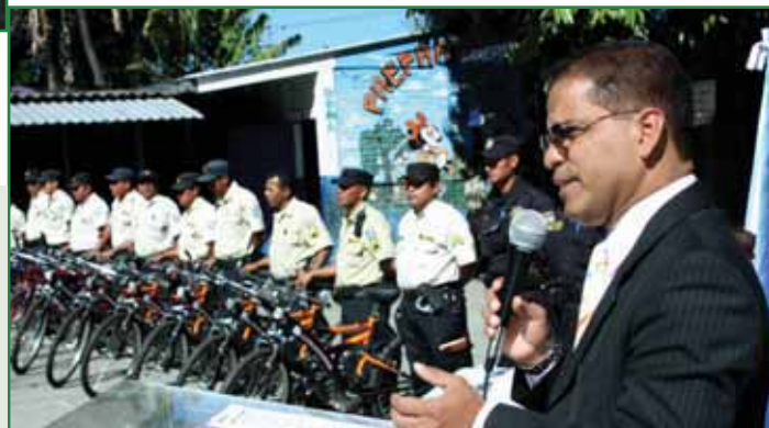
Lanzamiento del Plan Escuela Segura.

Conscientes de la ola delincencial que atraviesa nuestro país seguimos trabajando para que las familias gocen de un municipio más tranquilo y con más armonía.