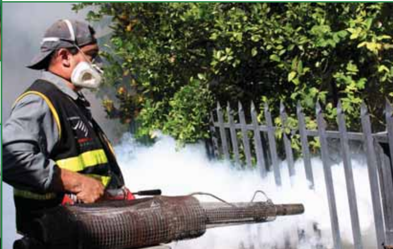
Fumigación parte de la campaña de limpieza en Colonia San Antonio

En el área de salud se ha fortalecido la atención de las clínicas municipales y la coordinación interinstitucional e intersectorial con el Ministerio de Salud, el Instituto Salvadoreño del Seguro Social, clínicas comunales, ONG`S, unidades de salud y la ciudadanía, que han hecho posible la realización de actividades como ferias de salud y campañas de prevención de enfermedades, demostrando que para tener una población más saludable es indispensable el involucramiento de todos y todas.