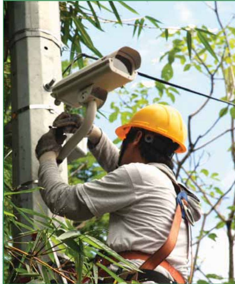
Instalación de cámaras de seguridad en El Cafetalón

Con la implementación del Plan de reordenamiento, el proyecto seguridad inalámbrica, la instalación de cámaras en El Cafetalón, el sistema WI-FI, equipamiento de espacios públicos, fortalecimiento de la seguridad en centros escolares y colonias, así como el mejoramiento de los espacios recreativos estamos haciendo realidad el ideal de hacer de nuestra querida ciudad un municipio modelo en materia de prevención.