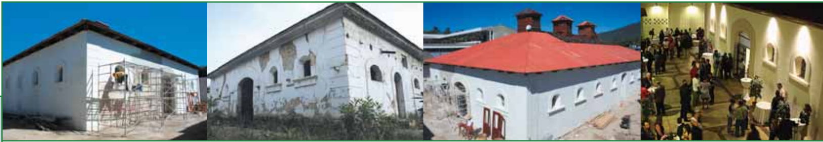
Avances en obras Museo Tecleño