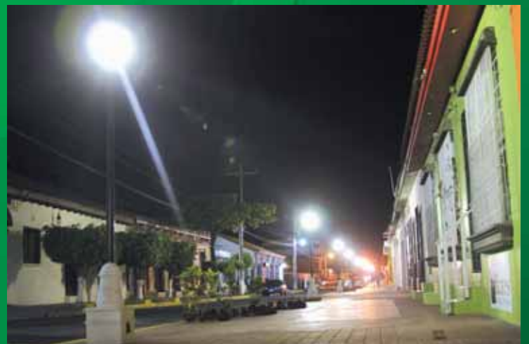
Paseo El Carmen Fase III y IV

Con el apoyo del proyecto “Red Latinoamericana PROLOGO” (Propuestas Locales de Gobernabilidad)