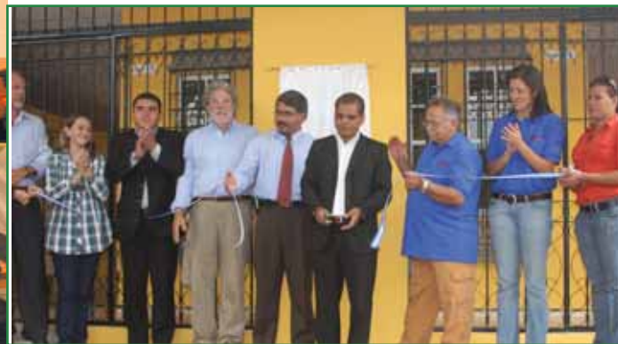
Director de Protección Civil Jorge Meléndez junto al CISS y autoridades municipales inauguran la adecuación de baños públicos en El Cafetalón.

El mejoramiento de nuestros espacios recreativos y de sano esparcimiento para nuestra niñez y juventud, la seguridad, la reparación de la red vial, la educación, la proyección de nuestra cultura y el turismo son algunas de las áreas que se han fortalecido con el apoyo de los diferentes ministerios y entidades del Gobierno Central .