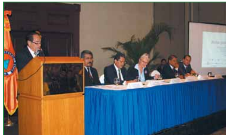
VI Conferencia de Gestión de Riesgos