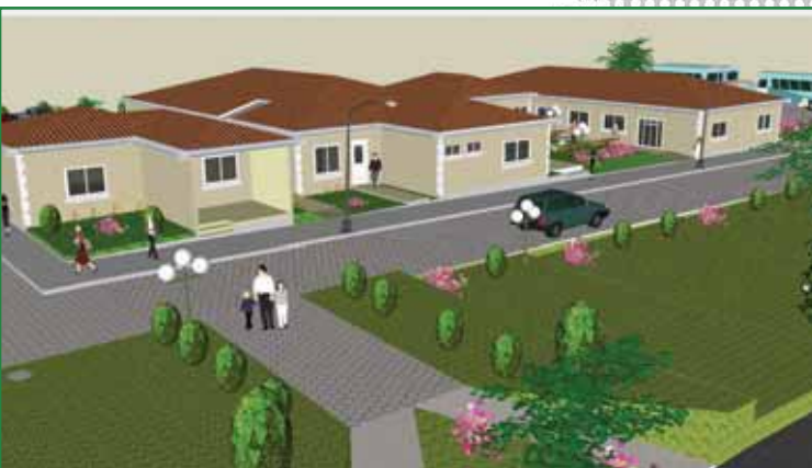
Casa del Adulto y Adulta Mayor

Soñar en grande nos ha permitido alcanzar cosas grandes. Durante nuestra gestión hemos demostrado que es posible materializar cualquier desafío que nos propongamos, con optimismo, trabajo, esfuerzo y confianza en el futuro y en que juntos y juntas haremos realidad el gran ideal de ver consolidados los cambios en nuestra querida Santa Tecla.