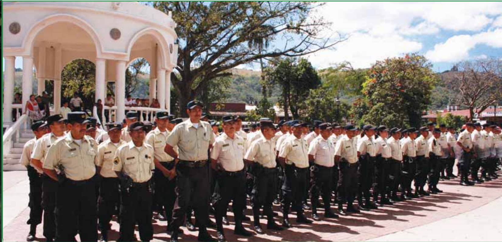
Miembros del Cuerpo de Agentes Municipales (CAM) durante el lanzamiento del “Plan Tranquilidad Ciudadana”.