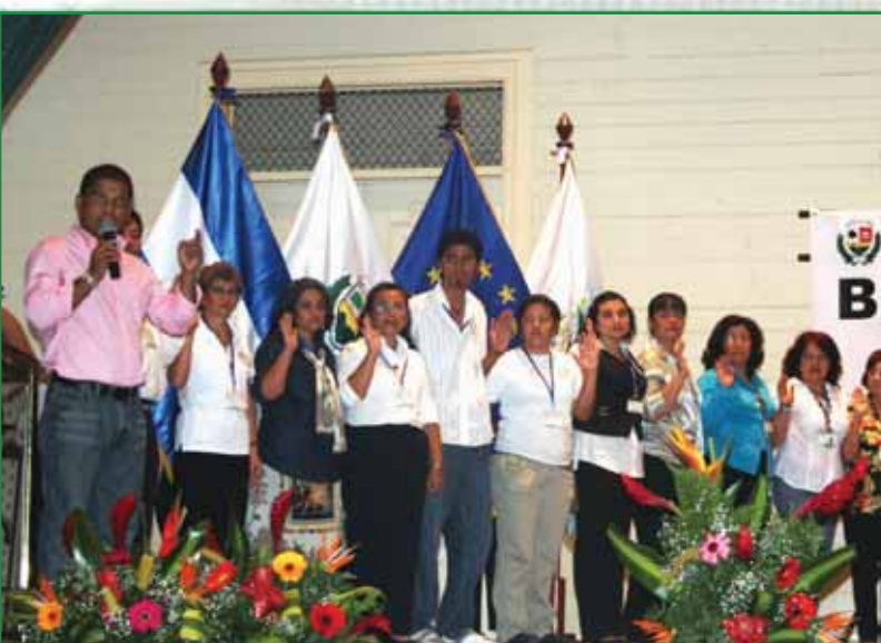
Juramentación del nuevo Concejo Ciudadano para el Desarrollo Local durante Asamblea Ciudadana.