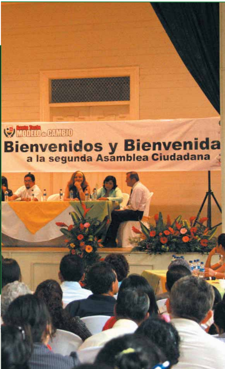
Segunda Asamblea Ciudadana del CCDL, Hogar del Niño Adalberto Guirola.