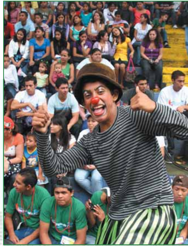
Segundo Festival de la Juventud, El Cafetalón.

Además, Santa Tecla fue tomada en cuenta este año para participar en el proyecto “Sello de municipio aprobado” realizado por la UNICEF, con el fin de medir los indicadores y acciones que impulsa el municipio a favor de la niñez y juventud. Acciones como estas son las que perfilan a nuestra ciudad como un modelo de desarrollo humano.