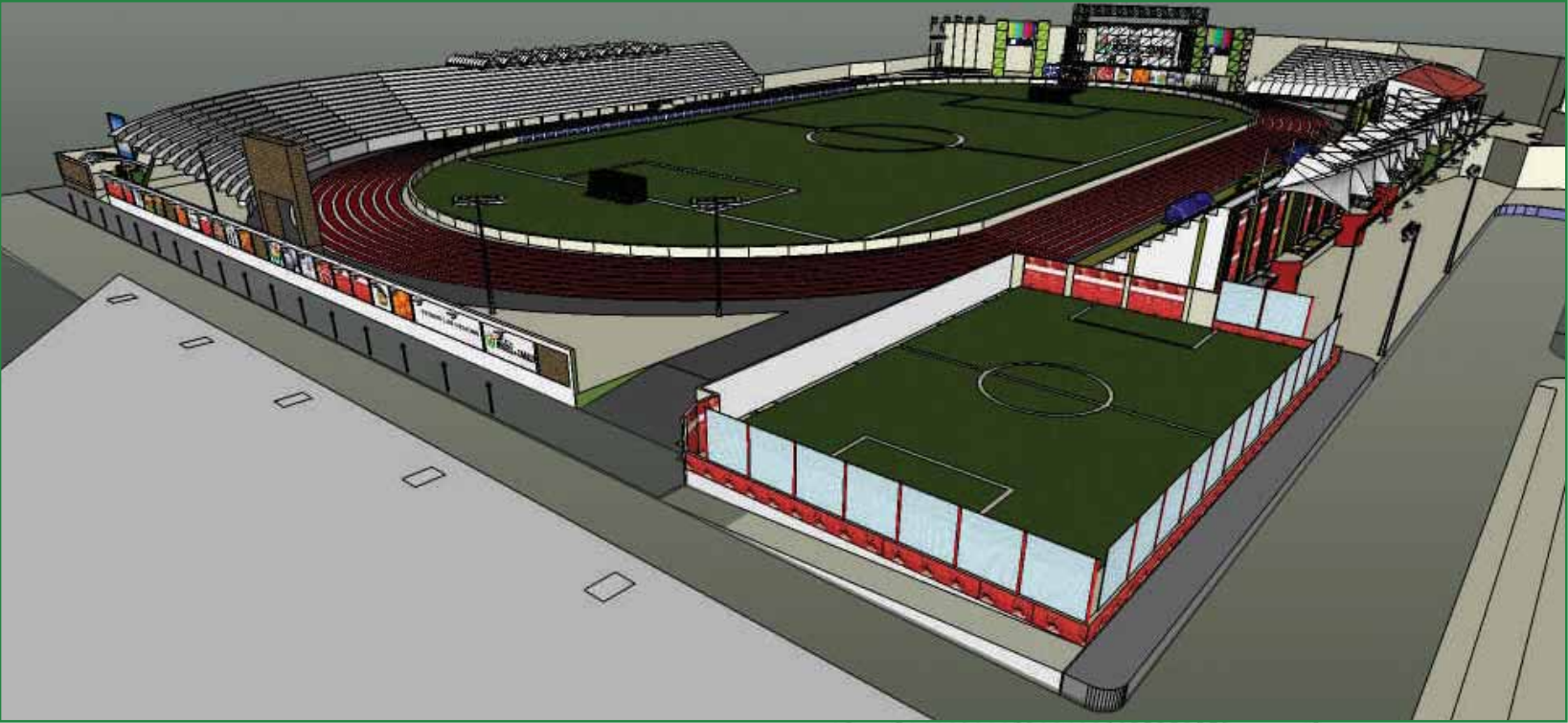
Remodelación Estadio Municipal Las Delicias

Soñar en grande nos ha permitido alcanzar cosas grandes. Durante nuestra gestión hemos demostrado que es posible materializar cualquier desafío que nos propongamos, con optimismo, trabajo, esfuerzo y confianza en el futuro y en que juntos y juntas haremos realidad el gran ideal de ver consolidados los cambios en nuestra querida Santa Tecla.