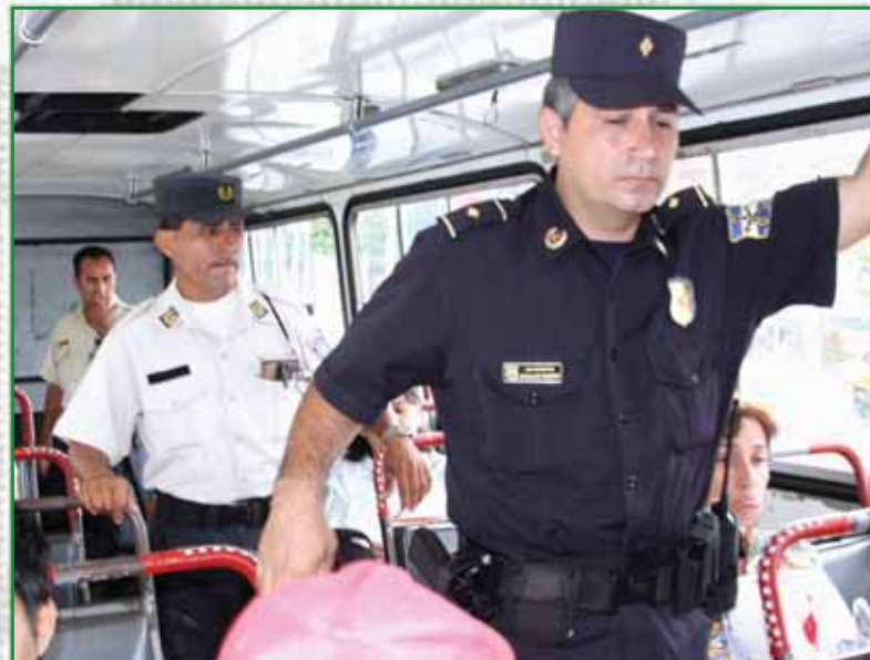
Agentes del CAM y junto a la PNC implementan "Plan Bus"

Con la implementación del Plan de reordenamiento, el proyecto seguridad inalámbrica, la instalación de cámaras en El Cafetalón, el sistema WI-FI, equipamiento de espacios públicos, fortalecimiento de la seguridad en centros escolares y colonias, así como el mejoramiento de los espacios recreativos estamos haciendo realidad el ideal de hacer de nuestra querida ciudad un municipio modelo en materia de prevención.