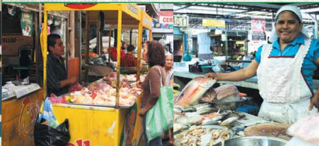
El Mercado Dueñas se ha convertido en una alternativa de compras para la ciudadanía y una oportunidad de negocios para los vendedores.

Estamos haciendo de Santa Tecla un municipio próspero y una ciudad de oportunidades, impulsando las microempresas locales, promoviendo iniciativas que den un respiro a la economía familiar y nos permitan perfilarnos como un modelo de desarrollo económico.