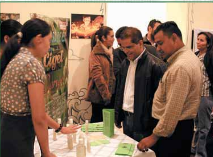
El Museo Tecleño acogió la Feria Empresarial en el mes de diciembre.

Como parte de este trabajo se realizó la segunda feria municipal de empleo, la inauguración del Centro de Asesoría Tecnológica para el Desarrollo Empresarial, que busca dinamizar la economía de la familia tecleña mediante la incorporación de las tecnologías de la información y comunicaciones en las micro y pequeñas empresas locales, además se ha brindado apoyo a la agricultura local y se fomenta el emprendedurismo.