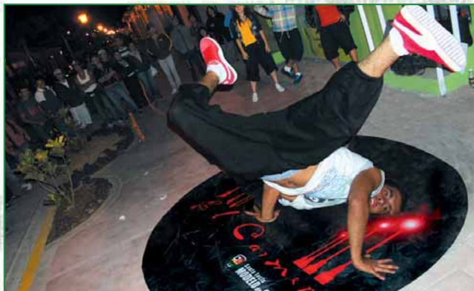
Exhibición de Breakdance durante la inauguración de la 3° y 4° fase del Paseo El Carmen.

En este año se ha continuado apostando al protagonismo de la juventud como una de las fuerzas vivas de nuestra querida Santa Tecla, es por ello que la municipalidad ha realizado una serie de actividades y proyectos con el objetivo de incentivar a la juventud teclena a que brinden su aporte en los procesos de cambio de nuestra ciudad.