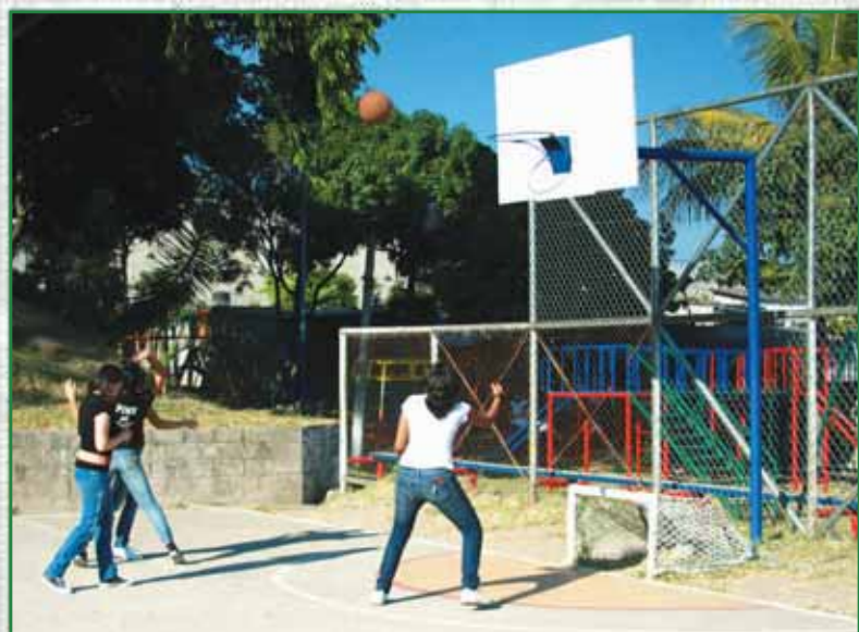
Pequeña Obra de Gran Impacto (POGI) en Colonia La Sabana.

Estamos seguros que la consolidación de las transformaciones en nuestro municipio solo será posible si continuamos haciéndolo de una manera concertada e incluyente, mano a mano de la fuerza ciudadana.