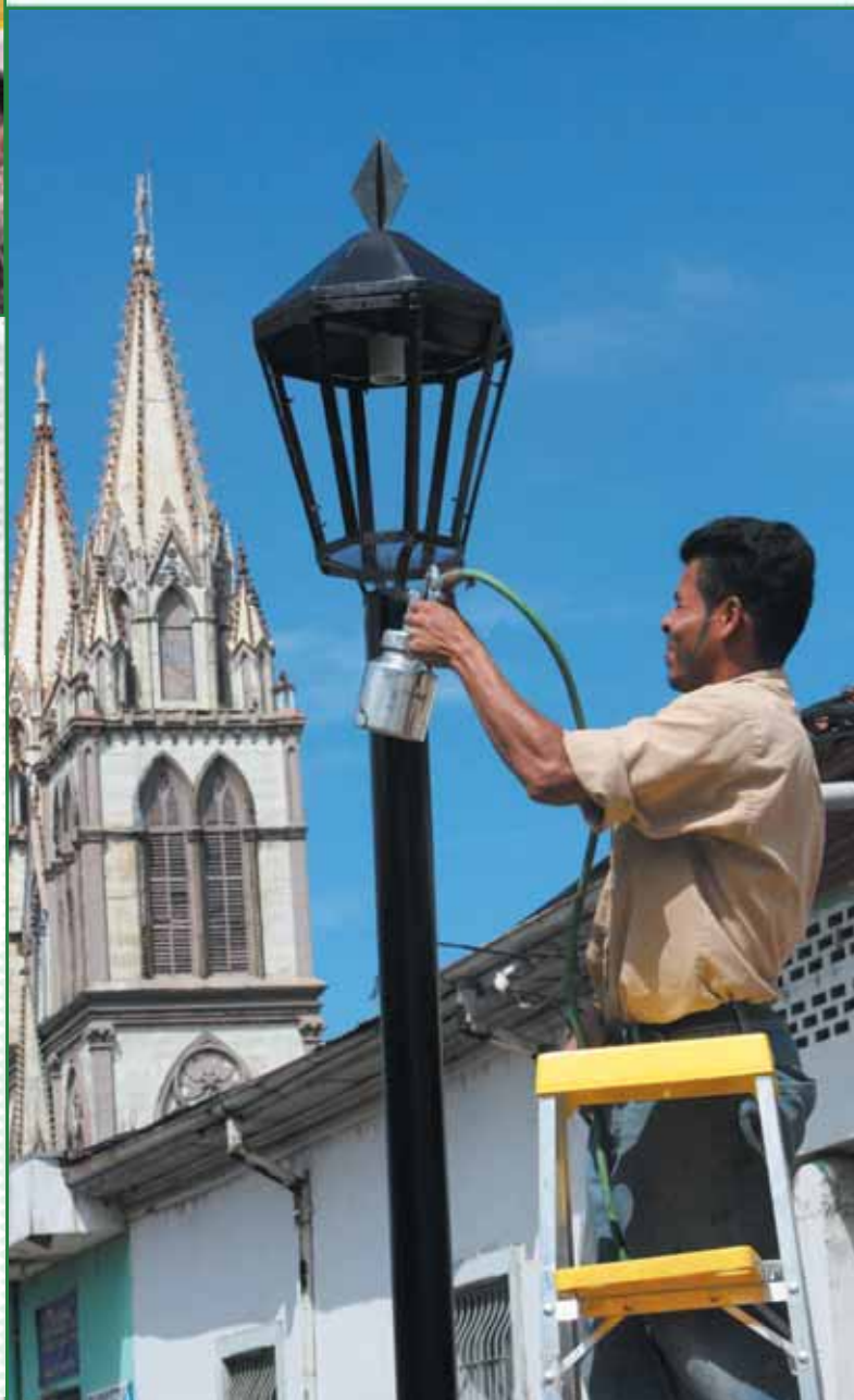
Avances Paseo El Carmen Fase III