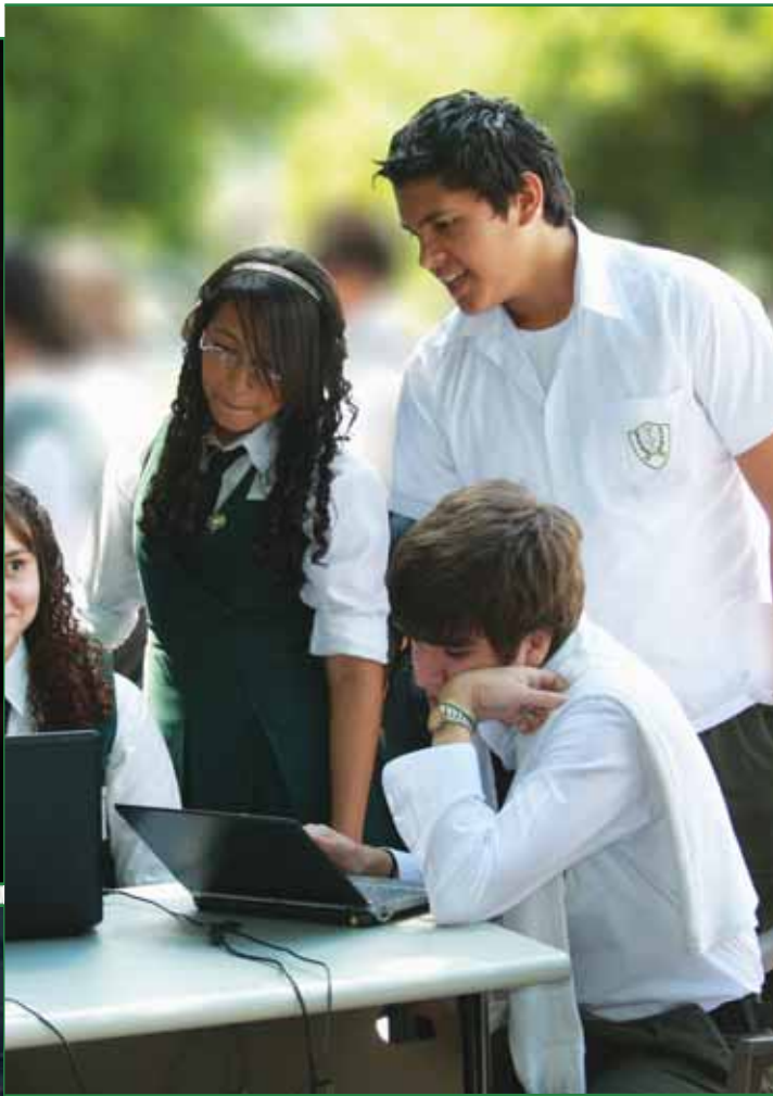
Estudiantes haciendo uso del sistema de Internet inalámbrico (Wi-Fi) en las instalaciones de El Cafetalón.