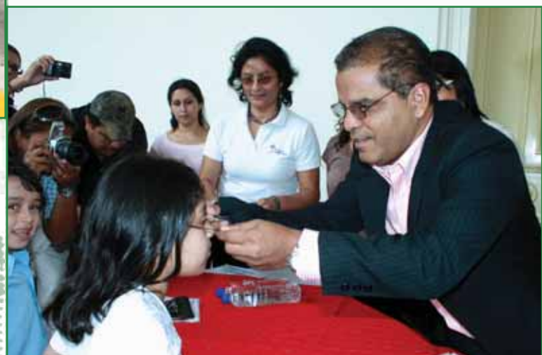
Entrega de paquetes escolares y anteojos a la niñez por parte del Alcalde Oscar Ortiz