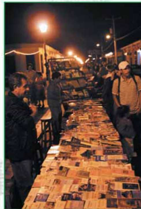
Apoyo al emprendedurismo local.