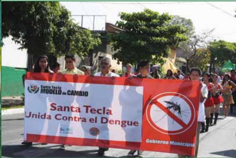
Campaña contra el Dengue

En el área de salud se ha fortalecido la atención de las clínicas municipales y la coordinación interinstitucional e intersectorial con el Ministerio de Salud, el Instituto Salvadoreño del Seguro Social, clínicas comunales, ONG`S, unidades de salud y la ciudadanía, que han hecho posible la realización de actividades como ferias de salud y campañas de prevención de enfermedades, demostrando que para tener una población más saludable es indispensable el involucramiento de todos y todas.