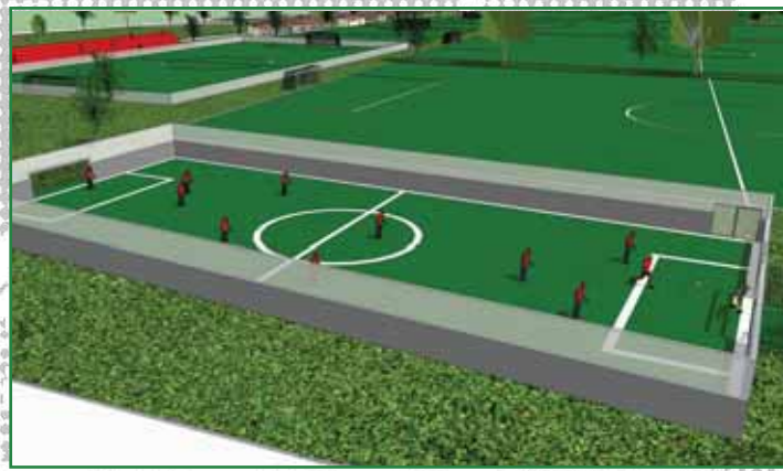
Pro-Jovenes II Remodelación Canchas del Cafetalón