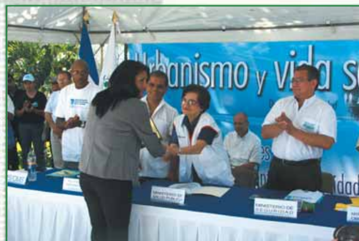
Alcalde Ortiz, Ministra de Salud María Isabel Rodríguez y Ministro de Seguridad Manuel Melgar en Día Mundial de La Salud.