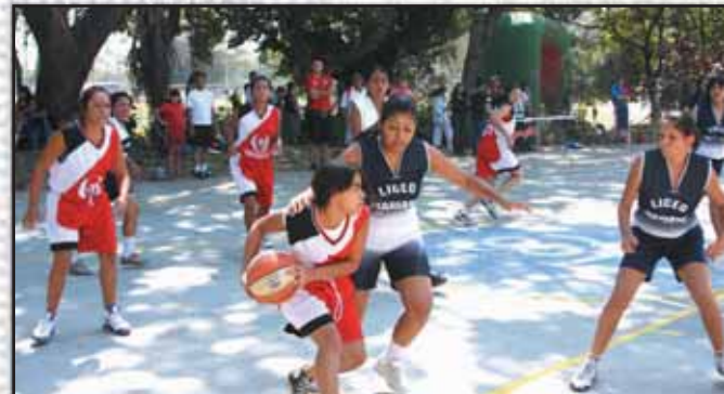
Torneo de basquetbol femenino en El Cafetalón.

Para este año se ha continuado trabajando en las diferentes escuelas deportivas del municipio: patinaje, natación, fútbol, basquetbol, aeróbicos, karate y softbol, apostándole siempre a descubrir y explotar el talento de nuestra niñez y juventud en las diferentes disciplinas y de esta forma aportar al país nuevos representantes en las competencias nacionales e internacionales.