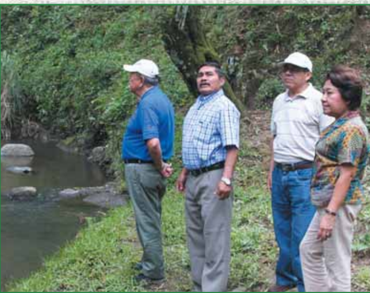
Miembros del Concejo Municipal en recorrido por cantones de la zona sur.

Durante todo este año el Gobierno Local en coordinación con la ciudadanía realizó campañas de limpieza integrales en las diferentes comunidades del municipio. También han continuado en funcionamiento las plantas de reciclaje y compostaje, lo que permite un manejo más adecuado de los desechos.