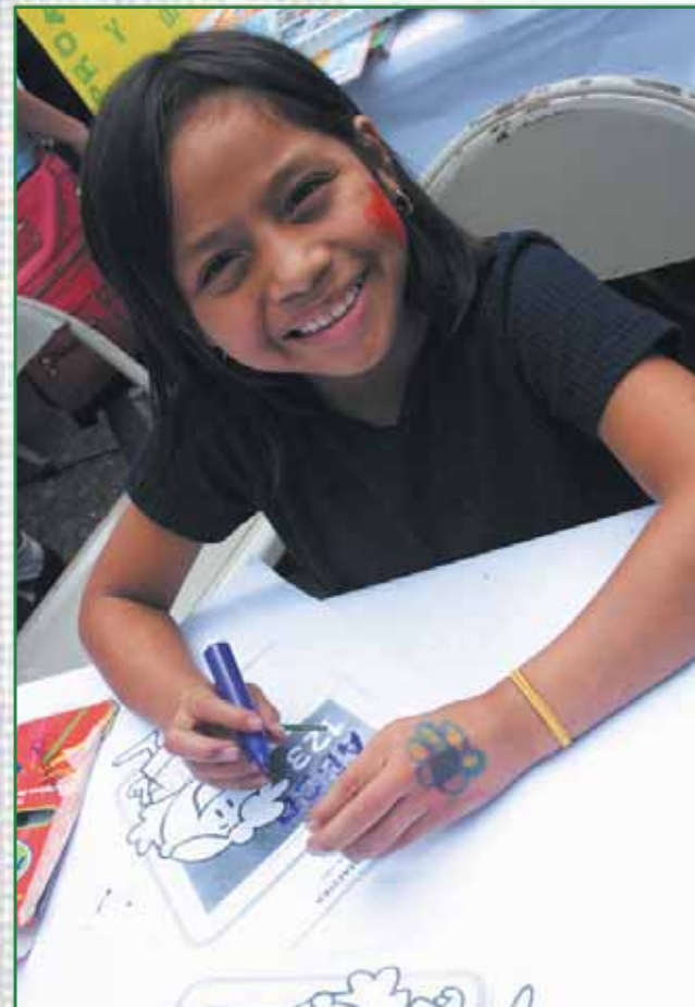
Festival de la Lectura, Parque San Martín.