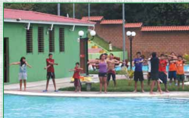
Escuela municipal de natación en Parque Acuático El Cafetalón