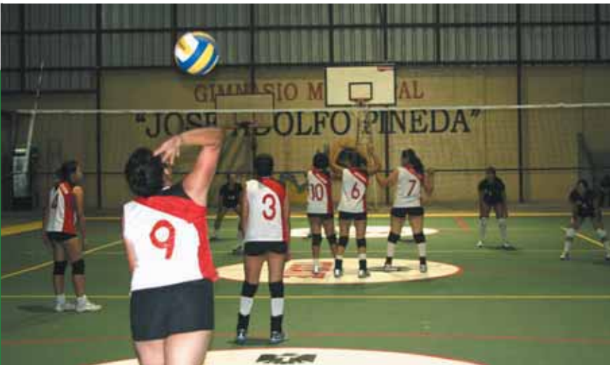
Torneo de Volleyball femenino en Gimnasio Municipal "Adolfo Pineda"

De igual forma, se siguen fortaleciendo los escenarios deportivos y recreativos en la ciudad y se trabaja en mejorar los espacios de sano esparcimiento en las colonias y comunidades de nuestra querida Santa Tecla.