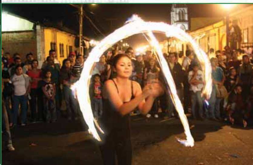
Festival Artístico Cultural en el Paseo El Carmen