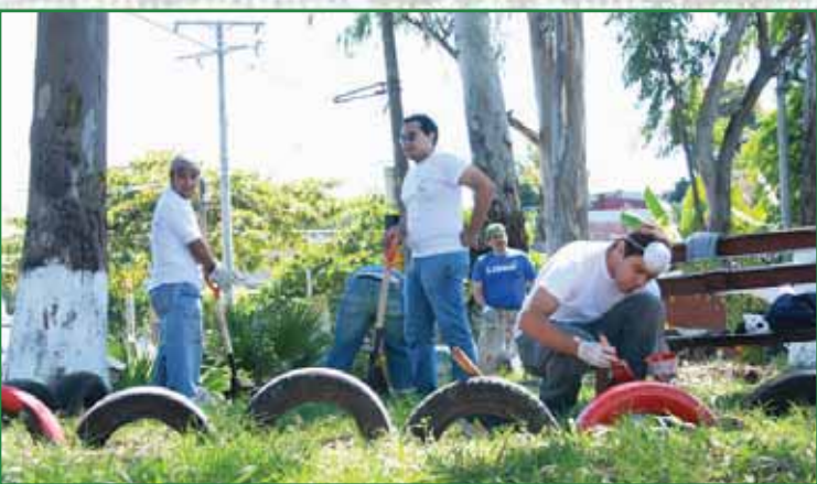
Voluntariado juvenil en pinta de muros en Centro Deportivo El Cafetalón

Brigadas y Comités Ambientalista. A través de las Brigadas y Comités Ambientalista la municipalidad ha realizado diversas acciones educativas y de concientización, para hacer ver a nuestra ciudadanía la importancia de cuidar y proteger nuestro entorno natural. Las Brigadas y Comités ambientales también realizan campañas de recolección de material reciclable, reforestación y otras, encaminadas a tener una Santa Tecla en mayor armonía con el medio ambiente.