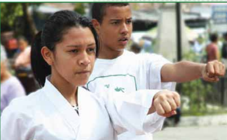
Escuela de Karate en el lanzamiento del plan "Vacaciones Deportivas"

A través del deporte y la recreación buscamos generar condiciones para que la niñez y juventud desarrollen actividades creativas, se mantengan alejadas de la violencia y se fomente sano esparcimiento, la buena salud y la convivencia en la familia teclena en general.