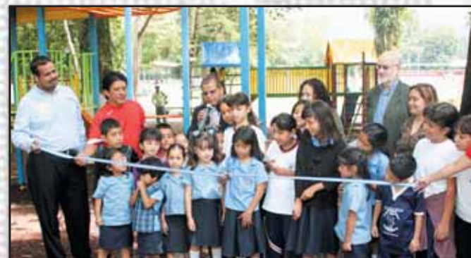
Inauguración juegos infantiles en El Cafetalón