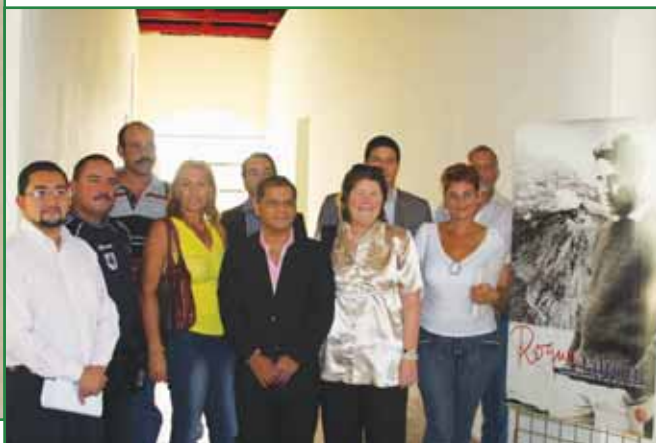
Visita delegación Cubana

Con el mismo compromiso que hemos trabajado hasta ahora, seguiremos de la mano de la cooperación caminando hacia la construcción de un municipio con más oportunidades para todos y todas.