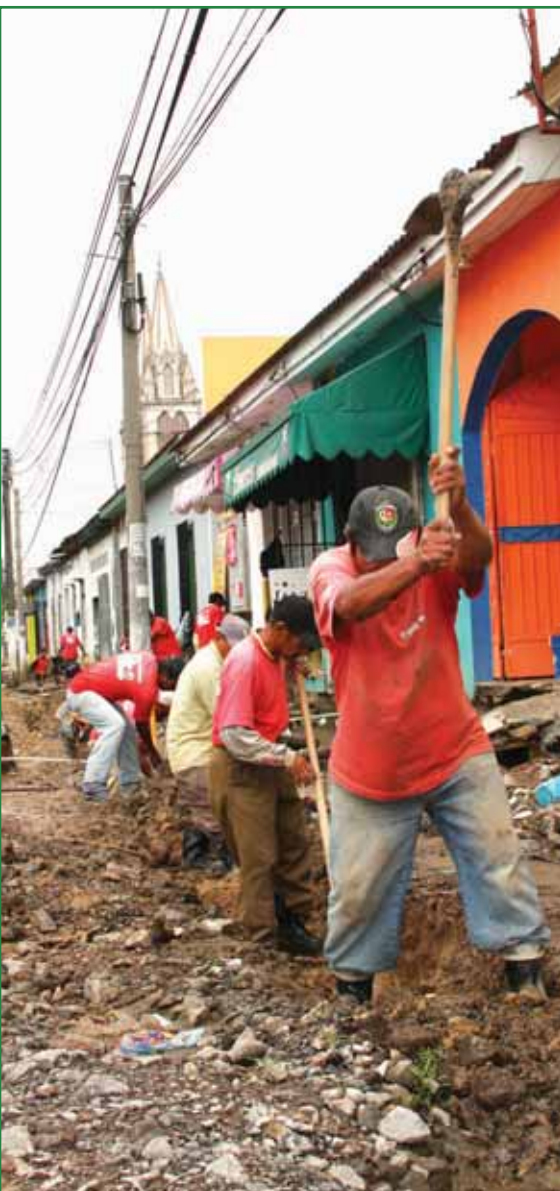
Paseo El Carmen Fase II