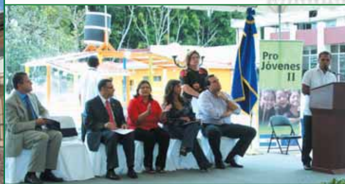
Lanzamiento del proyecto Pro-Jóvenes II que busca la apertura de espacios seguros para la juventud.

Por medio de acciones concretas e innovadoras y gracias a la buena coordinación interinstitucional hemos continuado posicionando a Santa Tecla como un municipio seguro.