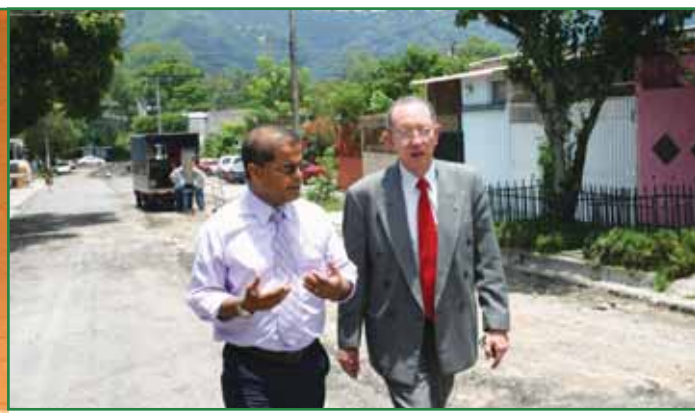
Vice-Ministro de Obras Públicas Roberto Góchez y Alcalde Municipal inspeccionan trabajos de recarpeteo en Colonia Quezaltepec.