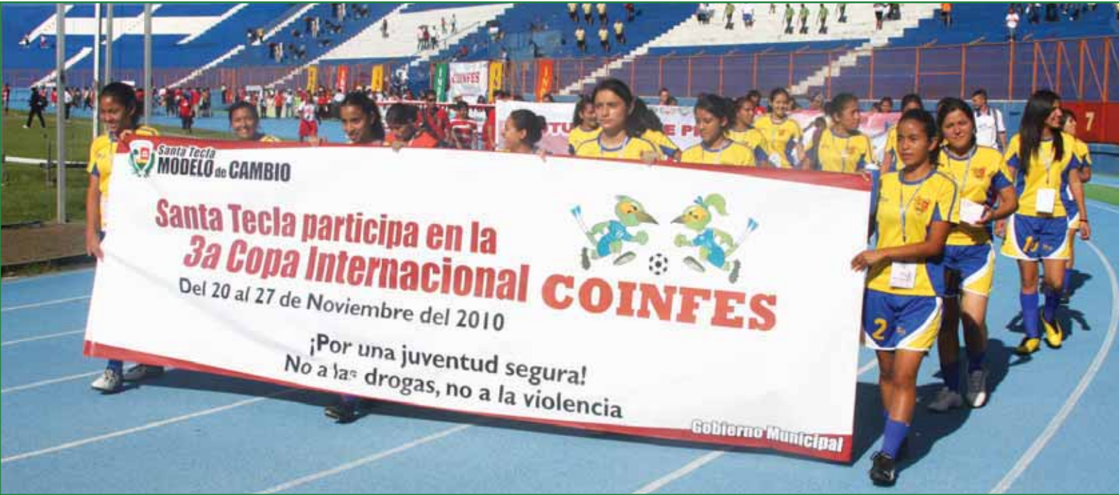
Olimpia Azul y Oro F.C representan al municipio en la 3° Copa Internacional de El Salvador (COINFES).

A través del deporte y la recreación buscamos generar condiciones para que la niñez y juventud desarrollen actividades creativas, se mantengan alejadas de la violencia y se fomente sano esparcimiento, la buena salud y la convivencia en la familia teclena en general.