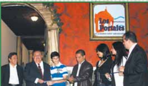
Inauguración de Restaurante Los Portales en el Paseo El Carmen