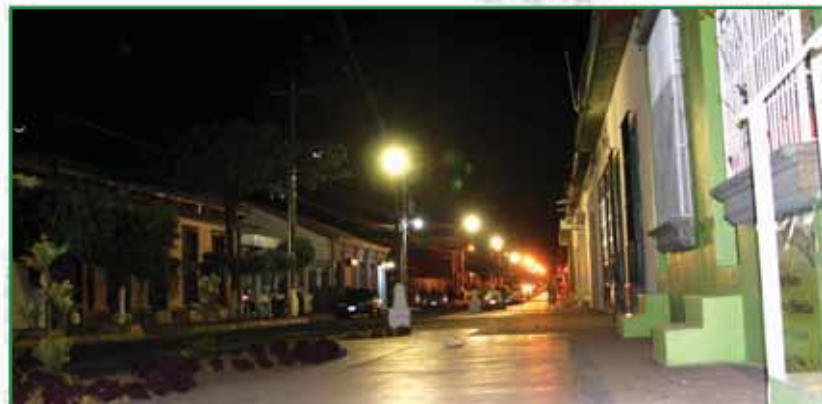
Paseo El Carmen

Como acciones principales hemos puesto en marcha el Plan de reordenamiento del Centro Histórico, así como la construcción de la manzana educativa y el Paseo El Carmen, con lo que estamos haciendo realidad nuestro desafío de recuperar el sistema de aceras y hacer del municipio un lugar para caminar y convivir.