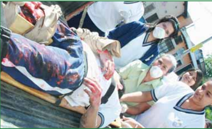
Simulacro de terremoto en Colegio Belén

El área de gestión de riesgos ha formado parte de la gran estrategia por construir una ciudad más segura, por lo que, junto a aliados estratégicos, preparamos al municipio para responder de una manera más ágil, eficiente y oportuna ante situaciones de emergencias.