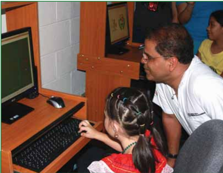
Inauguración de Centro Integral de Cultura y Convivencia Ciudadana en Equidad, Colonia San Antonio.