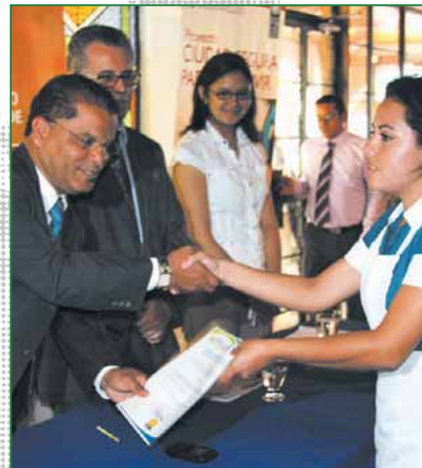
Entrega de certificados de becas por parte del ITCA y la municipalidad.

En el marco del Proyecto Ciudad Segura para Convivir financiado por el PNUD y administrado por la municipalidad se otorgaron 200 becas vocacionales cortas en diseño grafico, diseño web, pastelería, panadería y alimentos, así como 29 becas técnicas de dos años en ingeniería de sistemas informáticos o ingeniería de redes informáticas, con una inversión de $ 72,000.00, que incluye el costo de admisión, matriculas, mensualidades, gastos de graduación, entre otros.