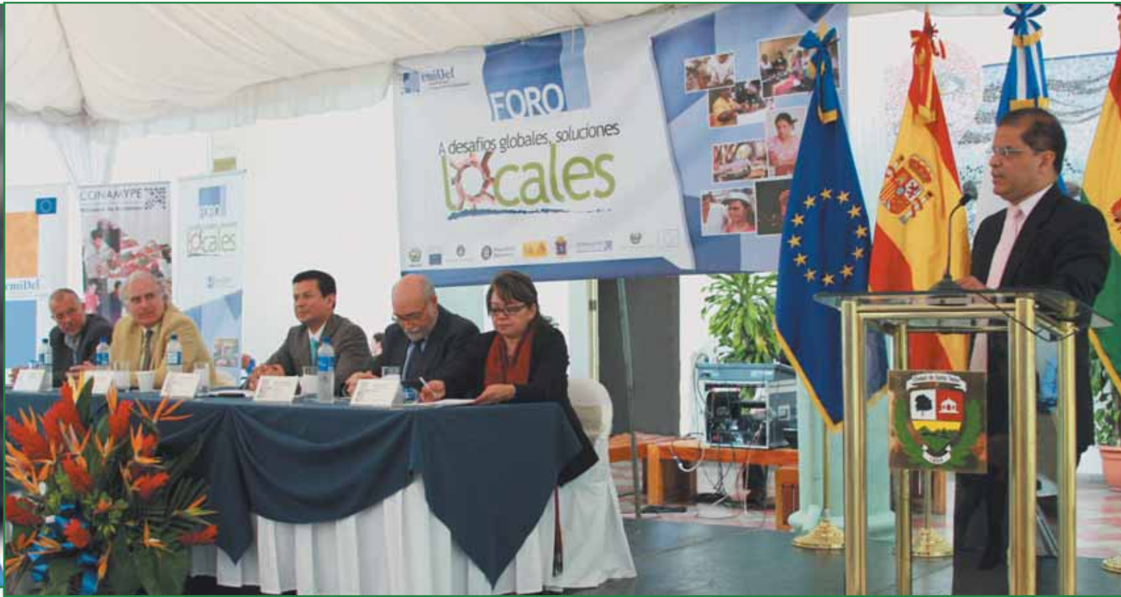
Foro EMIDEL, A desafíos Globales Soluciones Locales

Estamos haciendo de Santa Tecla un municipio próspero y una ciudad de oportunidades, impulsando las microempresas locales, promoviendo iniciativas que den un respiro a la economía familiar y nos permitan perfilarnos como un modelo de desarrollo económico.