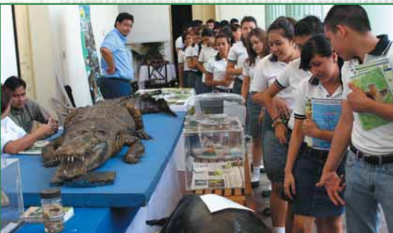
Expo Ambiente realizada dentro de las intalaciones del Palacio Teclño.

Además, Santa Tecla fue tomada en cuenta este año para participar en el proyecto “Sello de municipio aprobado” realizado por la UNICEF, con el fin de medir los indicadores y acciones que impulsa el municipio a favor de la niñez y juventud. Acciones como estas son las que perfilan a nuestra ciudad como un modelo de desarrollo humano.