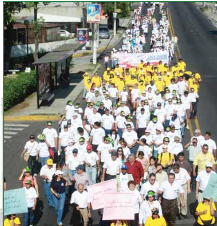
Caminata por el Día Mundial de la Salud Calle Chiltiúpan