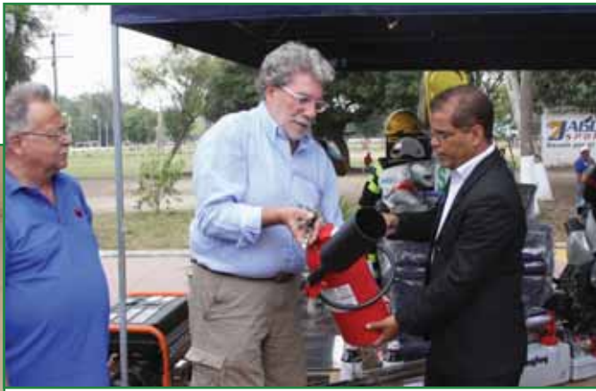
Donación de equipos de salud y rescate por parte de la Cooperazione Italiana y Cooperazione Internazionale Sud Sud (CISS)

El acompañamiento de nuestros cooperantes ha permitido la ejecución de los proyectos más ambiciosos de nuestro Gobierno Local y la continuación exitosa de los programas solidarios que benefician a la niñez, juventud y familia en general.