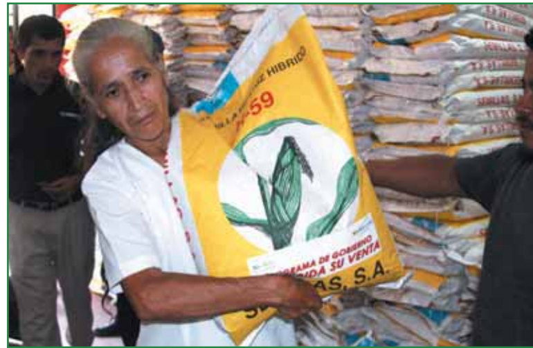
Entrega de Paquetes Agrícolas